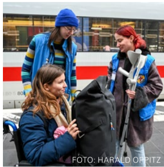
Zwei junge Mitarbeitende helfen einer Frau im Rollstuhl nach ihrer Ankunft im Frankfurter Hauptbahnhof.

Eben noch haben zwei Mitarbeiterinnen einer alten Dame mit schwerem Gepäck beim Umsteigen geholfen, kurz darauf sucht ein wohnungsloser Mann Schutz und eine warme Tasse Tee. „Man weiß nie, wer als Nächster durch