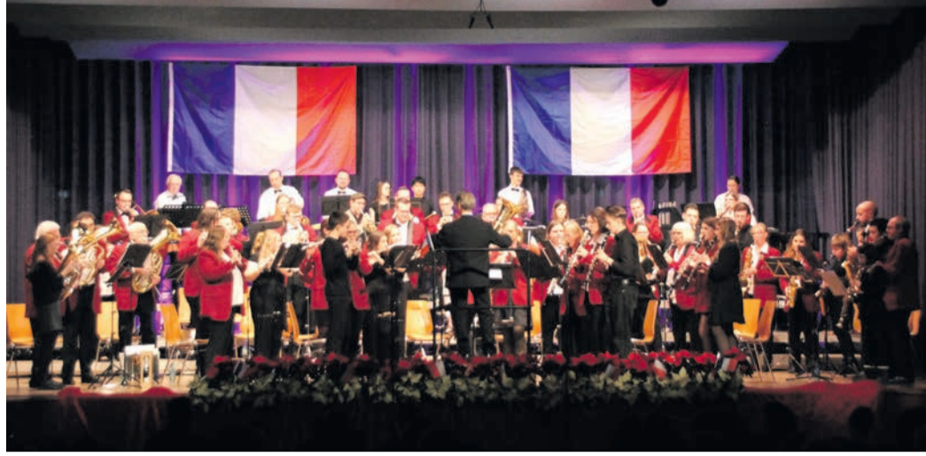
Jugendorchester und Großes Orchester bei der gemeinsamen Zugabe zum Ende des Konzerts.

Nach der Pause übernahm das Große Orchester unter der bewährten Leitung von Piotr Konczewski. Mit dem anspruchsvollen Werk „The Count of Monte Cristo“ gelang ein fulminanter Einstieg in den zweiten Konzertteil. Ein musikalisches Porträt