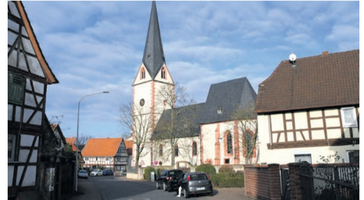
Fachwerk und die Evangelische Kirche prägen das Ortsbild im Münsterer Ortsteil Altheim. Dort dürfen am 15. März mehr als 2000 Wahlberechtigte erstmals einen Ortsbeirat wählen. Fünf Stimmen darf jeder dabei vergeben.

Altheim (jedö) Die Bürger im Münsterer Ortsteil Altheim haben am 15. März – oder vorab per Briefwahl – besonders viele Entscheidungen zu treffen. Neben den 81 Stimmen bei der Kreiswahl (der Kreistag wächst in der nächsten Wahlperiode von 71 auf 81 Abgeordnete) und den 37 bei der Wahl der Münsterer Gemeindevertretung dürfen sie auch je ein Kreuz bei der Münsterer Bürgermeister-Wahl und dem Bürgerentscheid zur Rücknahme des Beschlusses für den Bau zweier Lärmschutzwände westlich des Altheimer Bahnhofs platzieren. All das betrifft sämtliche Münsterer Bürger. In Altheim kommen aber noch fünf Kreuze hinzu: Erstmals wählen die Wahlberechtigten dort einen Ortsbeirat. Mittlerweile ist klarer, wie diese Wahl ablaufen wird.