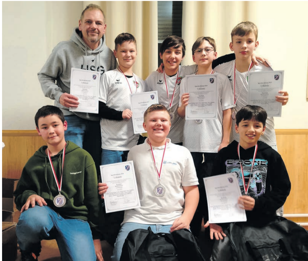
Da kommen gute Handballer nach: Die HSG/EMU feierten mit dem Jahrgang 2014/15 die Bezirksmeisterschaft.