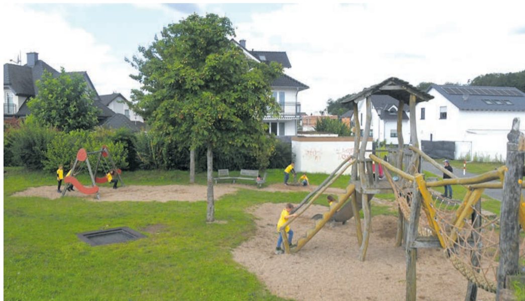
Unter anderem 35 000 Euro für den Ersatz des größten Spielgeräts auf dem Spielplatz „Auf der Bayerswiese“ (Foto) will die Gemeinde Eppertshausen im kommenden Jahr ausgeben. Für 2026 hat Bürgermeister Stephan Brockmann einen tiefroten Etat-Entwurf eingebracht.

Eppertshausen (jedö) Bürgermeister Stephan Brockmann (CDU) hat am Mittwochabend einen tiefroten Haushaltsentwurf 2026 ins Eppertshäuser Ortsparlament eingebracht. Nach der letzten Gemeindevertreter-Sitzung des Jahres erläuterte er das Zahlenwerk, das von den Abgeordneten Anfang des Jahres noch im Haupt- und Finanzausschuss behandelt wird, bis zum Beschlusstermin am 29. Januar aber keine allzu wesentlichen Änderungen mehr erfahren dürfte, im Gespräch mit dem Autor dieser Zeilen ausführlicher.