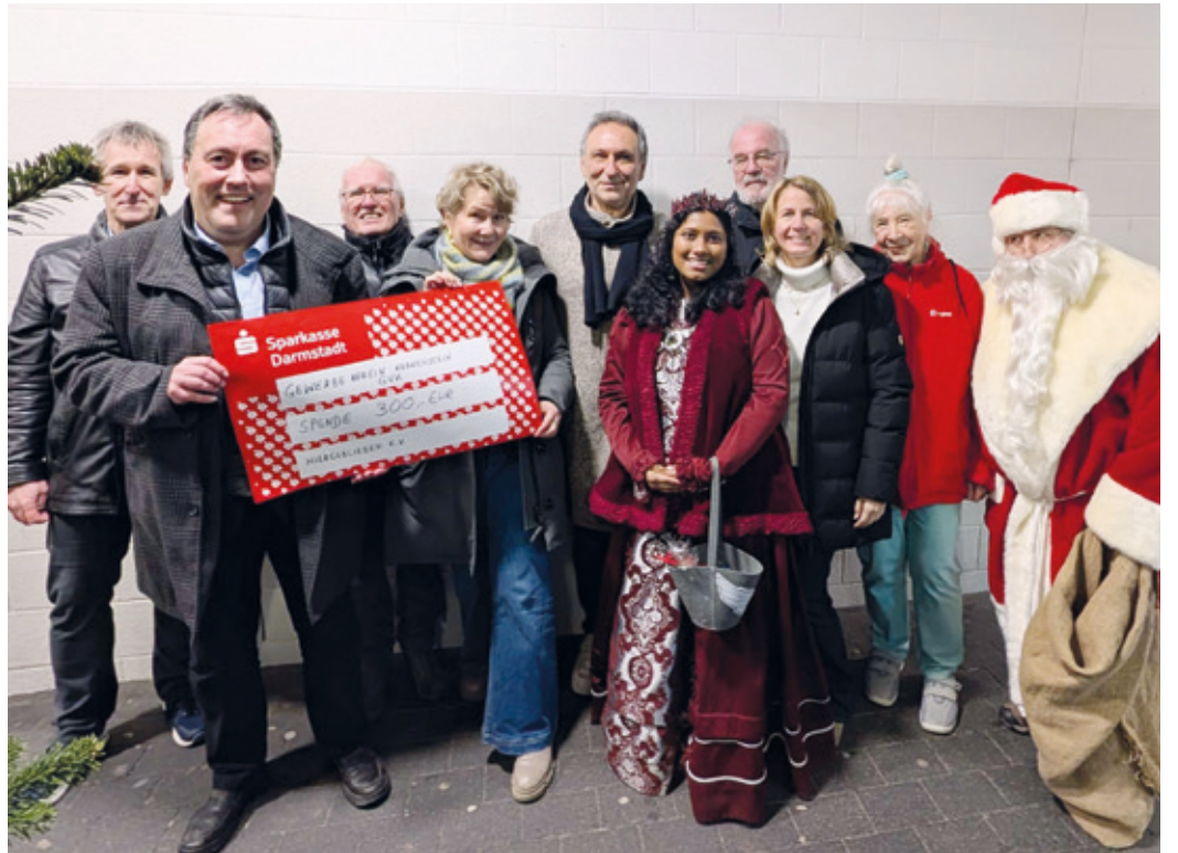
GVK-Spendenübergabe an Hiergeblieben e.V.