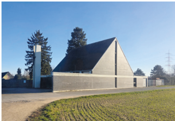
Friedhof mit Trauerhalle.

Erzhausen (ca). Erzhausen braucht jetzt Mut zur Entscheidung. Wir treten an, um die Gemeinde nachhaltig, transparent und generationengerecht weiterzuentwickeln – mit einem klaren Fokus auf Planung, Wohnraum und öffentliche Räume.