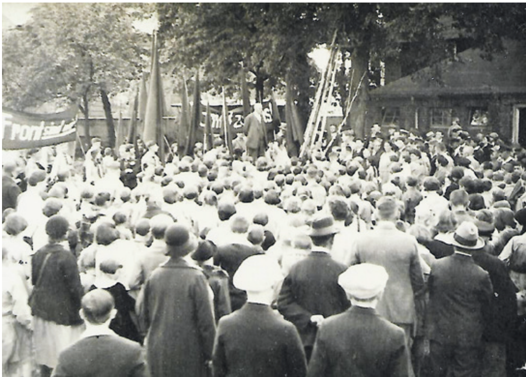
Der „Goldne Löwe“ ist am 31. Januar d.J. Treffpunkt eines historischen Rundgangs über „Verfolgung und Widerstand unterm Hakenkreuz“ in Arheilgen. Dieses historische Foto entstand bei einer Kundgebung im Biergarten am 3. Juni 1932. Dort sprach damals der Gewerkschafter und Sozialdemokrat Wilhelm Leuschner. Leuschner war 1932 Innenminister des Volksstaates Hessen und ein entschiedener Gegner der NSDAP. Bereits Ende 1931 hatte er Pläne für eine gewaltsame Machtübernahme der NSDAP veröffentlicht. Trotz Misshandlungen in Konzentrationslagern und Gefängnissen arbeitete er nach der Machtübergabe an die Nazis im politischen Widerstand. Er wurde am 29. September 1944 durch Erhängen an einem Fleischerhaken in Berlin-Plötzensee hingerichtet.

Historischer Rundgang am 31. Januar in Arheilgen – Treffpunkt 14 Uhr am „Löwen“