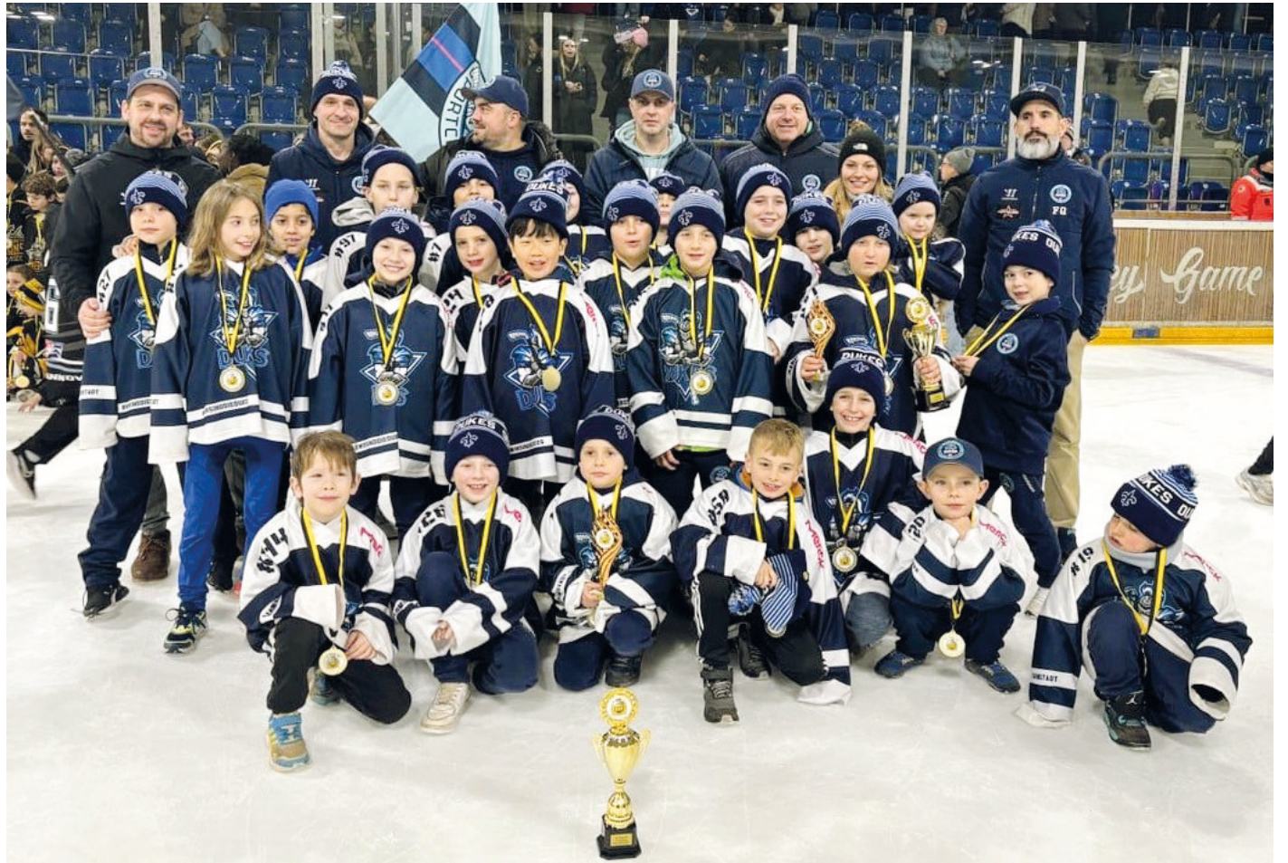
Ausgepowert und zufrieden am Turnierende in Mannheim: U9 und U11 der Dukes gemeinsam mit Trainern, Teamleitern und Betreuern.

Darmstadt (mjn). Die Nachwuchssteams der Darmstadt Dukes haben zwischen den Jahren am international besetzten 17. Kids Cup in Mannheim teilgenommen und wertvolle Erfahrungen gesammelt.