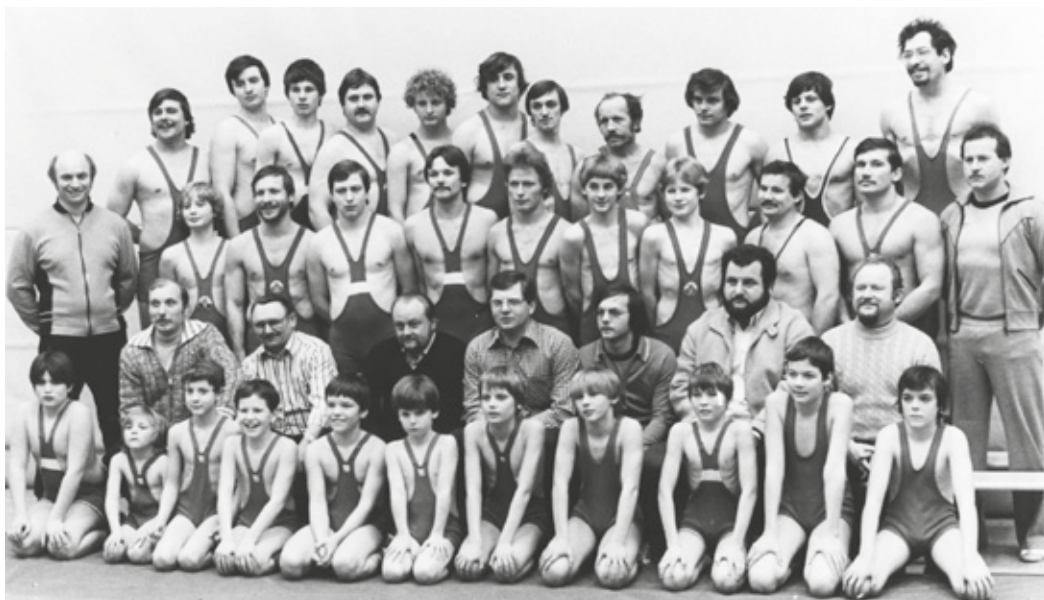
Gruppenfoto der SGA Ringer von 1980.