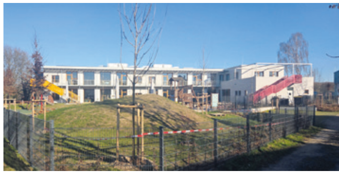
Neue Kindertagesstätte Hainpfad.

Erzhausen (ca). Am 15. März 2026 entscheiden die Bürgerinnen und Bürger über die Zukunft Erzhausens. Wir treten an, um unsere Gemeinde sozial gerecht und generationenübergreifend aufzustellen – mit einem klaren Fokus auf Betreuung und Bildung.