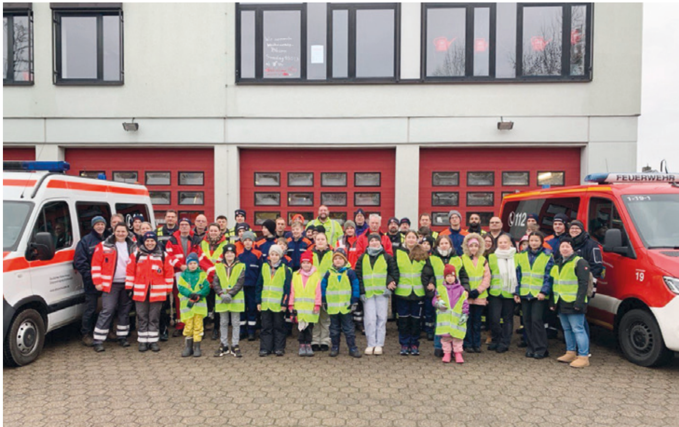
Die Helfer von DRK und Freiwilliger Feuerwehr kurz vor dem Ausrücken zum Weihnachtsbäumensammeln.

Erzhäuser (kr). Am vergangenen Samstag führten das DRK Erzhäuser und die Freiwillige Feuerwehr Erzhäuser, jeweils mit Unterstützung ihrer Jugendgruppen, die gemeinsame Sammelaktion der Weihnachtsbäume mit anschließendem Winterfeuer durch.