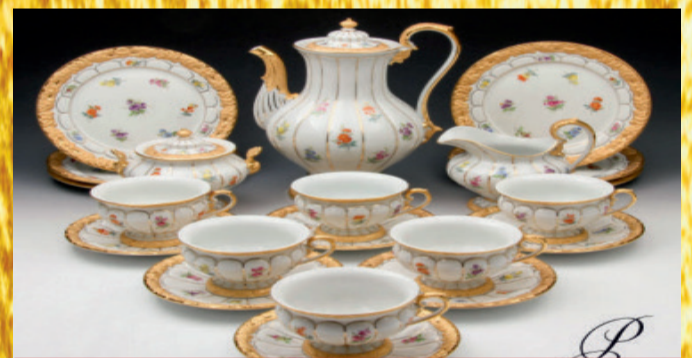
Porzellan namhafter Hersteller**