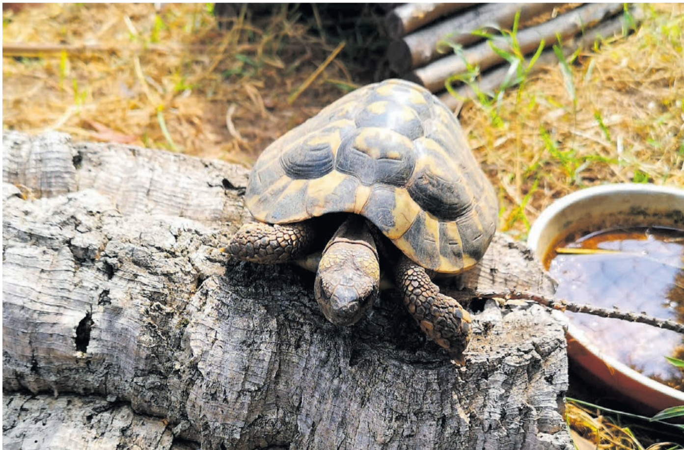
Eine griechische Landschildkröte.

„Ein Tier ist kein Weihnachtsgeschenk, sondern eine langfristige Verantwortung. Wer ein Lebewesen aufnimmt, schenkt nicht nur Freude, sondern verpflichtet sich zu Fürsorge, Wissen und Respekt“, betont Artenschutz-Expertin