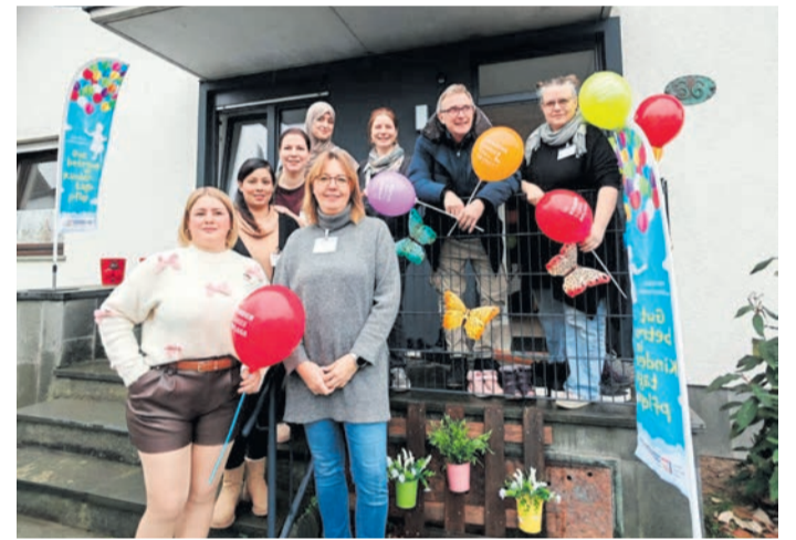
Ein erfolgreicher Tag der offenen Tür der Kindertagespflege in Heusenstamm.

Mehr zu Hessen Mobil und zum Verkehr auf Landesebene unter mobil.hessen.de .