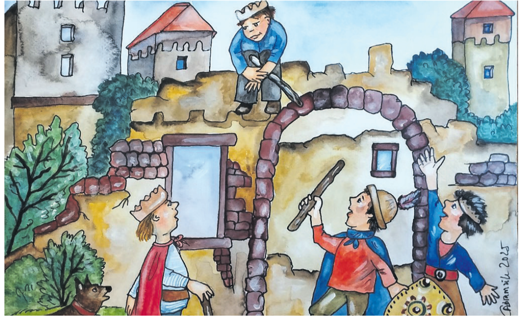
Abenteurer am Rodenstein.