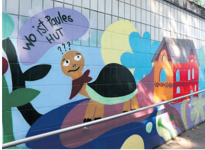
Mit bunten Bildern wurde im Rahmen eines Graffiti-Projekts der Kinder- und Jugendförderung die Bahnunterführung verschönert. Im Bild zu sehen ist Schildkröte Paule des Obertshausener Kinderschutzprojekts. Auch fürs nächste Jahr ist wieder ein Graffiti-Projekt geplant.

Sportlich ging es in diesem Jahr auch wieder mit der Teilnahme am 24-Stunden-Lauf in Rodgau zu. In Kooperation mit der ortsansässigen Hermann-Hesse-Schule ging ein Team von Schülerinnen und Schülern für Obertshausen an den Start. „Neben der großartigen sportlichen Leistung und dem Durchhaltevermögen ist zu erwähnen, dass der gesamte Erlös an einen guten Zweck geht – an den Verein