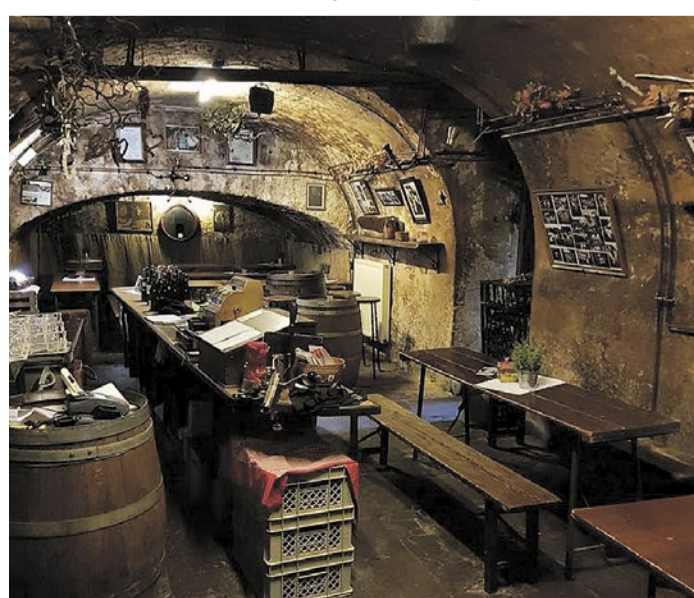
Zwischen Kellergewölbe und Weingenuss.