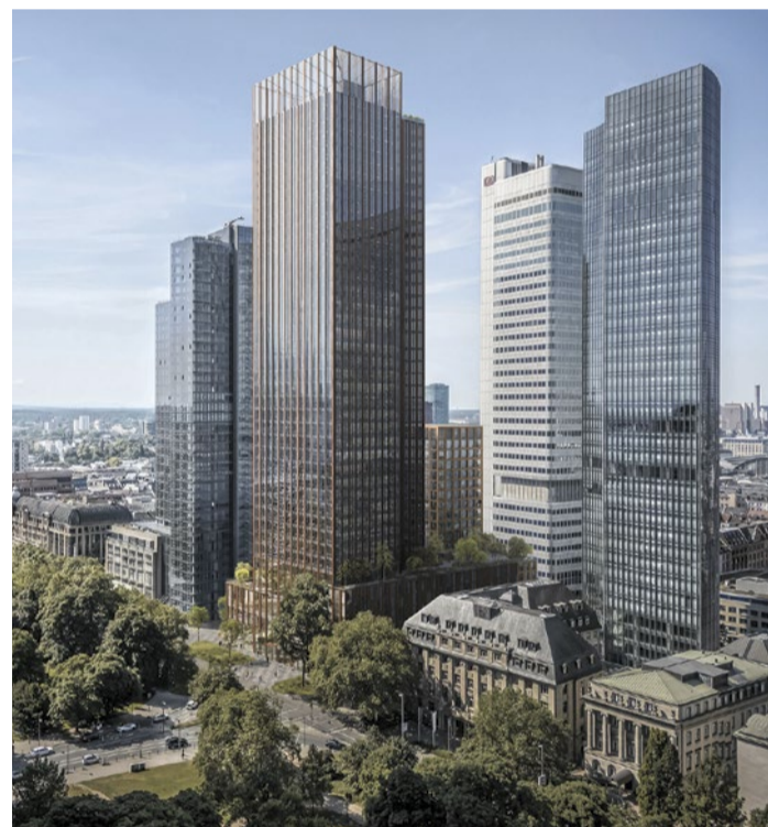
Hochhausentwurf ga8, Aerial.

Aufenthaltsqualität im Quartier deutlich erhöhen. Planungsdezernent Marcus Gwechenberger sieht mit dem Entwurf zentrale Ziele des Frankfurter Hochhausentwicklungsplans erfüllt. Das Projekt ga8 soll nicht nur die Skyline ergänzen, sondern einen lebendigen Stadtbaustein schaffen – offen, durchmischt und zukunftsfähig.