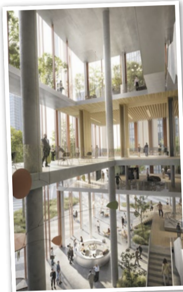
Hochhausentwurf ga8, Lobby.

Der kleinere Turm wird ein vielfältiges Wohnangebot bieten – von geförderten Wohnungen über studentisches Wohnen bis hin zu neuen Wohnformen. Zugleich setzt das Projekt neue Maßstäbe in Sachen Nachhaltigkeit: begrünte Dachgärten, Entsiegelung von Flächen, zusätzliche Baumpflanzungen und eine klimatisch optimierte Baukörperanordnung sollen das Mikroklima verbessern und die