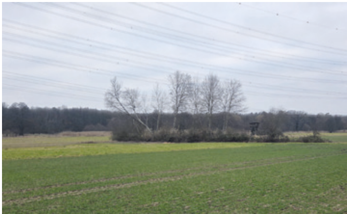
Feldholzinsel in der südwestlichen Gemarkung.

Erzhausen (ca). Am 15. März 2026 entscheiden die Bürgerinnen und Bürger über die Zukunft Erzhausens. Wir treten an, um unsere Gemeinde verantwortungsvoll, widerstandsfähig und klimafest für die kommenden Generationen aufzustellen.