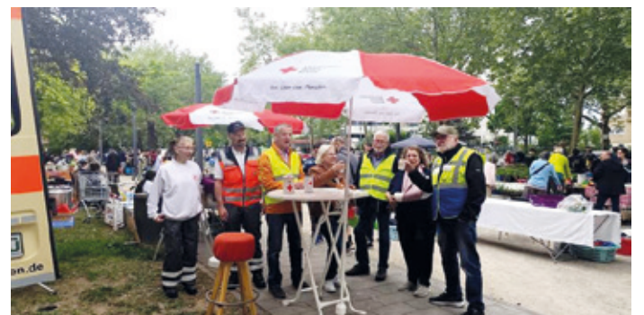
FKV Mitglieder mit den Aktiven des DRK 2025 am Flohmarkt Frühstücksstand.

Kranichstein (hv). Auch in 2026 sind in Kranichstein wieder die traditionellen Kranichsteiner Flohmärkte fest eingeplant. Der Frühjahrsflohmarkt findet am Samstag, dem 09. Mai, der Herbstflohmarkt am Samstag, dem 5. September, statt. Etwas verändert wurden aber die Zeiten, zu denen die Flohmärkte stattfinden. Beginn ist jetzt erst um 9 Uhr, ein Aufbau kann frühestens ab 8 Uhr beginnen, die Flohmärkte enden dafür erst um 15 Uhr. Da genügend Platz auf dem Flohmarktgelände auf der Neuen Mitte/Neuem Marktplatz und entlang der Bartningstraße für alle vorhanden ist, sind Anmeldungen nicht notwendig, es ist aber erforderlich, sich nach den Anweisungen der Helferinnen und Helfer zu richten. Auf den Flohmärkten darf alles Zulässige verkauft werden, alles was auf einen Flohmarkt passt. Nicht dazu gehören z.B. lebende