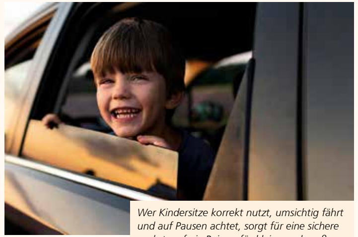
Wer Kindersitze korrekt nutzt, umsichtig fährt und auf Pausen achtet, sorgt für eine sichere und stressfreie Reise – für kleine und große Mitfahrer.

wie die Kollision zwischen einem abbiegenden Lkw und einem Radfahrenden oder zu Fuß Gehenden. In vielen Fällen liegt die Ursache im toten Winkel, der selbst durch zusätzliche Spiegel oder Kameras nicht vollständig eliminiert werden kann. Abbiegeassistenten, die akustisch und optisch warnen oder gar eine automatische Bremsung einleiten, sind inzwischen Pflichtausstattung in Neufahrzeugen. Auch Auffahrunfälle von Lkw stellen weiterhin ein erhebliches Gefahrenpotenzial dar, obwohl Gesetzgeber und Fahrzeughersteller im Laufe der Jahre eine Vielzahl von Maßnahmen ergriffen haben. „Trotz dieser technologischen Fortschritte bleiben Ablenkungen durch Smartphones, Müdigkeit und Termindruck weiterhin wesentliche Ursachen für schwere Auffahrunfälle“, berichtet Stefanie Ritter aus der Unfallforschung. Mehr zum Thema unter www.dekra-roadsafety.com (DEKRA)