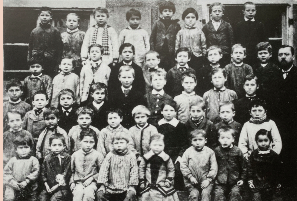
Klassenfoto der Grundschule in Günsbach (zweite Reihe von vorne, Vierter von rechts: Albert Schweitzer)

(Albert Schweitzer: Aus meiner Kindheit und Jugendzeit, München 1985)