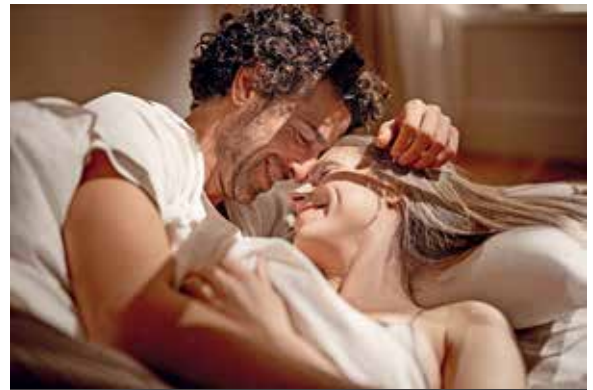
Entspannt durchschlafen und neue Kräfte tanken: Ein individuell angepasstes Schlafsystem trägt dazu bei.

Aus diesem Grund empfiehlt der Experte, eine fachkundige Beratung im Handel vor-