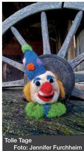
Tolle Tage

Redaktion Monatsjournal www.Monatsjournal.de Redaktion@Monatsjournal.de Südstraße 11, 61194 Niddatal