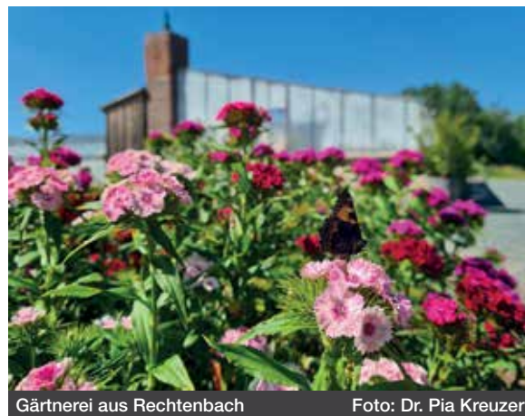
Gärtnerei aus Rechtenbach

Das Minzblatt verleiht dem Cocktail eine leicht scharfe Note und kann je nach Geschmack weggelassen werden. Wer eine säuerlichere Variante bevorzugt, kann den Bitter Lemon durch Zitronensaft ersetzen.