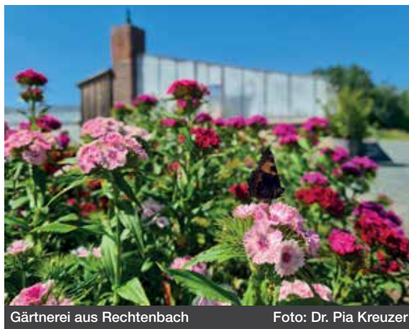
Gärtnerei aus Rechtenbach

Veranstaltet wird der Kinderfasching von der Kaascher Narrenschar gemeinsam mit dem neuen Bürgerhausteam.