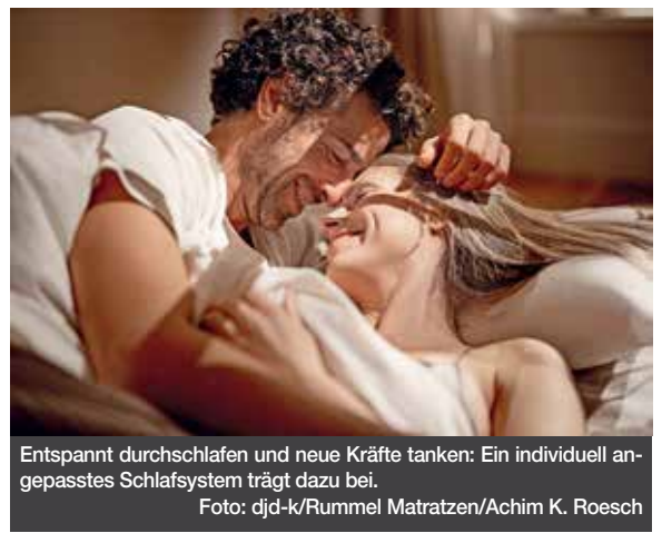
Entspannt durchschlafen und neue Kräfte tanken: Ein individuell angepasstes Schlafsystem trägt dazu bei.

Beratung im Handel vor Ort zu nutzen. Dazu gehört nicht zuletzt ein ausgiebiges Probeliegen. Viele Fachhändler bieten zudem sensorgestützte Körperanalysen an, bei denen die individuelle Liegeposition vermessen wird. Diese Daten helfen, die passende Matratze zusammenzustellen und den Liegekomfort auf die jeweiligen Bedürfnisse abzustimmen. Das Sensoflex-Schlafsystem beispielsweise lässt sich in verschiedenen Ausführungen, Größen und in unterschiedlichen Komfortstufen konfigurieren. Unter www.rummel-matratzen.de etwa finden sich mehr Informationen und Adressen von Ansprechpartnern im Fachhandel. Neben Ergonomie und Komfort legen viele heute auch Wert auf ökologische Aspekte. Bei dem deutschen Hersteller stehen seit langer Zeit die Qualität und Herkunft der Materialien, faire Arbeitsbedingungen sowie eine umweltfreundliche Produktion besonders im Fokus.