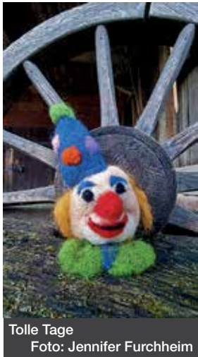
Tolle Tage

Im Freilichtmuseum Hessenpark im Taunus erleben Besucherinnen und Besucher eine Zeitreise in die Vergangenheit. Auf dem 65 Hektar großen Gelände vermitteln über 100 historische Gebäude Einblicke in das ländliche und kleinstädtische Leben vergangener Jahrhunderte in Hessen. Den Auftakt bildet die Spinnstube am 8. Februar sowie am 14. und 15. Februar jeweils von 11 bis 16 Uhr. In geselliger Atmosphäre zeigen Vorführungen im Spinnen, Sticken und Stricken, wie Flachs und Wolle früher verarbeitet wurden. Ergänzt werden die Vorführungen durch Erzählungen von Geschichten und Märchen.