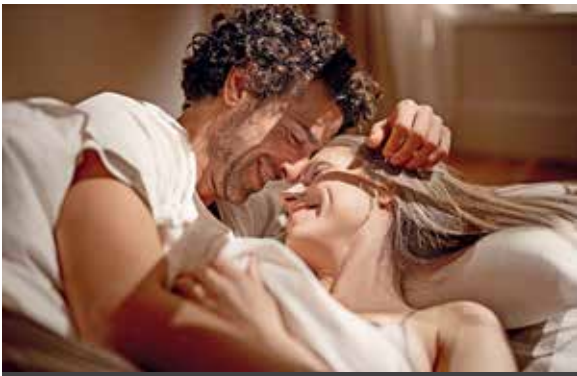
Entspannt durchschlafen und neue Kräfte tanken: Ein individuell angepasstes Schlafsystem trägt dazu bei.