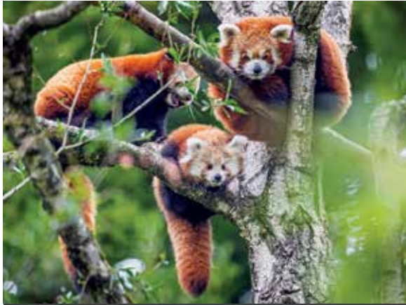
Eltern- und Jungtiere der Roten Pandas sind mit dem dicken Fell gut an winterliche Temperaturen angepasst.

In diesem Winter steht auch nächster Nähe im Giraffen- weiter der Nachwuchs von haus zu sehen. Die Elefanten- attraktiven Tierarten im Vor- herde mit dem am 27.05.2025 dergrund: Netzgiraffe „Kian- geborenen Elefantenkalb ga“ (geb. am 10.03.2025) ist „Kaja“ ist entweder auf der in der kalten Jahreszeit aus großen Außenanlage oder