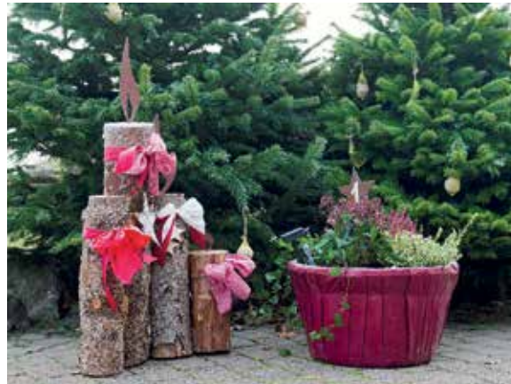
Eine der zwölf Stationen der Zoo-Rallye „Winter-Rundgang“

bei ungünstiger Witterung auf der Lauffläche des Elefantenhauses zu beobachten. Das im Juni geborene Jungtier bei den Roten Pandas mit dem Namen „Tian“ hingegen ist nun auf der Außenanlage in seinem Element, stammt diese Tierart doch aus den Bergwäldern des Himalayas und ist mit seinem dichten Fell gut an winterliche Kälte angepasst.