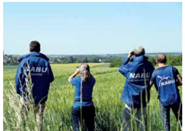
NABU-Naturführerinnen und -Naturführer vermitteln Wissen über Natur und Landschaft direkt vor Ort.

Ein digitaler Infoabend zur Ausbildung findet am 15. Januar 2026 um 19 Uhr statt.