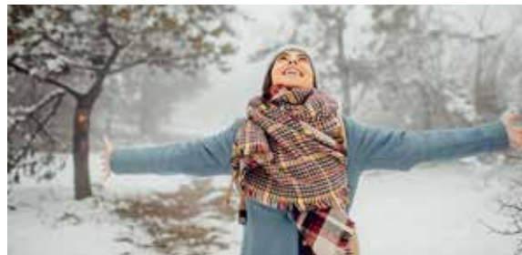
Befreit durchatmen auch in der Erkältungssaison - mit den richtigen Maßnahmen gegen angreifende Viren kann es gelingen.

Wie man die Atemwege natürlich befreien und Infektionen bekämpfen kann