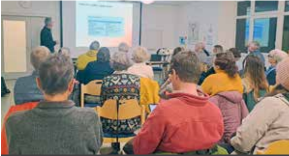
Informations- und Diskussionsveranstaltung der GRÜNEN Florstadt zur Artenvielfalt im Gemeindehaus in Nieder-Florstadt.

Informations- und Diskussionsveranstaltung zur biologischen Vielfalt im Gemeindehaus der evangelischen Kirche in Nieder-Florstadt