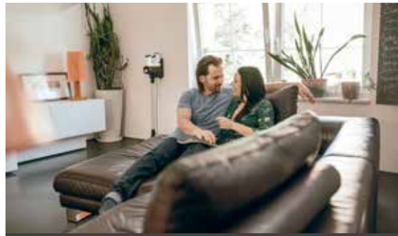
Putzen ist laut Studie eine Gemeinschaftsaufgabe – und schafft häusliche Harmonie.

Aktuelle Studie: Putzen trägt zum Wohlbefinden und mehr Zufriedenheit bei