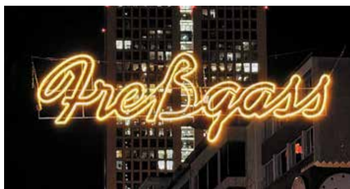
Das neue Freißgass-Schild bei Nacht.

Die Freißgass entstand bereits im 14. Jahrhundert als Handelsweg und entwickelte sich im 19. Jahrhundert zur gehobenen Einkaufs- und Gastronomiestraße – ein Status, den sie bis heute bewahrt hat.