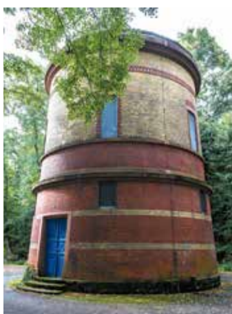
Stillgelegt, aber nicht vergessen.