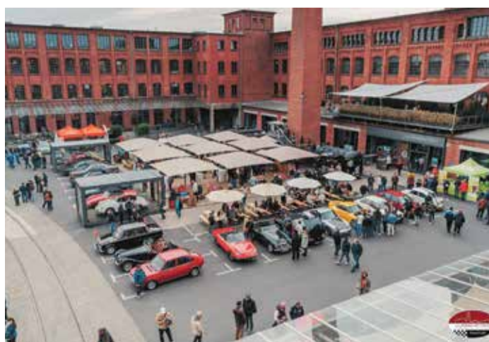
Industriedenkmal mit Event-Atmosphäre.

Mitten im Frankfurter Osten, in Fechenheim, hat sich ein Stück Kaffeekultur mit Tradition und Handwerk eingerichtet: die Wacker's Kaffee Rösterei. Hier röstet die Frankfurter auf knapp 400 m 2 ausgewählte Bohnen – im klassischen Langzeitverfahren, das Aromen ausbalanciert und Tiefe verleiht. Während viele große Ketten auf schnellen Coffee-to-go setzen, setzt Wacker's auf langsame Röstkunst und Nachhaltigkeit: Die frisch gerösteten Kaffeespezialitäten gehen nicht nur in eigene Cafés, sondern auch an lokale Gastronomen und Genießer in der ganzen Stadt. Begleitend bieten Schulungen