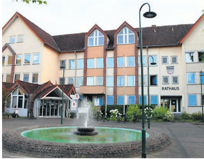
Vier Parteien und eine Wählergemeinschaft wollen für die kommenden fünf Jahren ins Münsterer Rathaus einziehen, wo die Gemeindevertretung und ihre Ausschüsse tagen. In Summe kandidieren für dieses Gremium 97 Personen, davon 72 Männer und 25 Frauen.

Wie berichtet, kämpfen um die fünf Mandate im Ortsbeirat Altheim die CDU, die SPD und die im Herbst 2025 neu gegründete Unabhängige Wählergemeinschaft „klar!“. Die CDU bietet neun Personen auf, sieben Männer und zwei Frauen. Listenplatz eins nimmt Marc Theisen ein, der damit auch als Anwärter aufs Amt des Ortsvor-