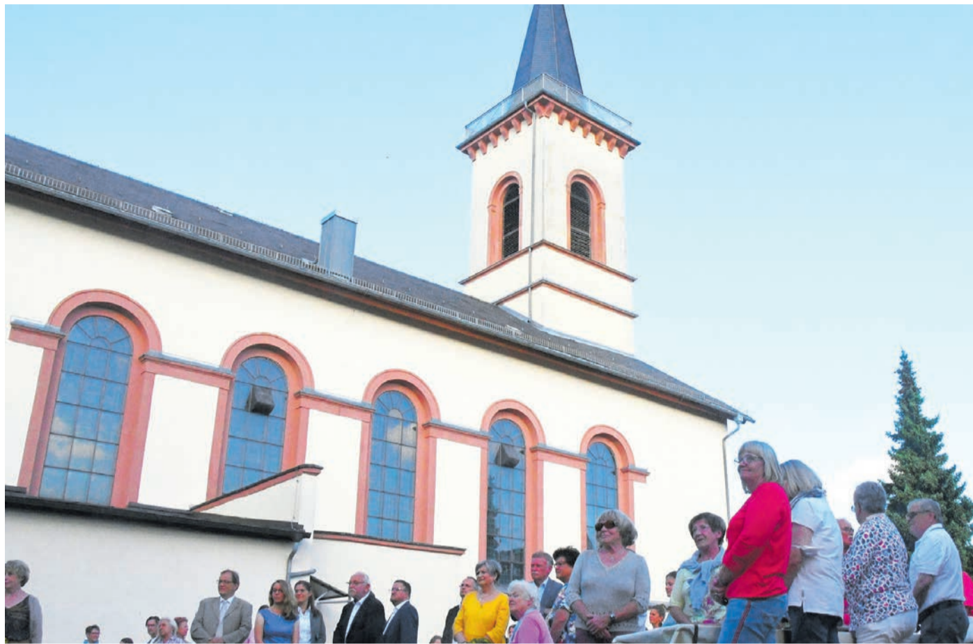
Die Kirche St. Sebastian in Eppertshausen. Die gleichnamige, bislang eigenständige Pfarrei wurde zum 31. Dezember aufgelöst und ist nun Teil der 16 000 Katholiken starken Pfarrei „St. Christophorus, Dieburger Land“.

Im Zuge der kirchlichen Erneuerungsbestrebungen endete zum 31.12. die Existenz von sechs bislang eigenständigen Pfarreien: St. Peter und Paul (Dieburg), St. Michael (Münster), St. Sebastian (Eppertshausen), St. Josef (Babenhäuser), St. Johannes Baptist (Mosbach) und St. Laurentius (Radheim) bestehen in ihrer bisherigen Form nicht mehr. Stattdessen ist nun die neu errichtete Pfarrei und Kirchengemeinde die Gesamtrechtsnachfolgerin der sechs aufgehobenen Pfarreien und Pfarrkuratien.