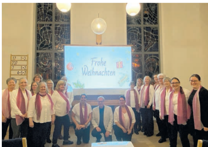
kum freut sich schon auf das dritte Nieder-Röder Stimmenfunkeln im nächsten Jahr!