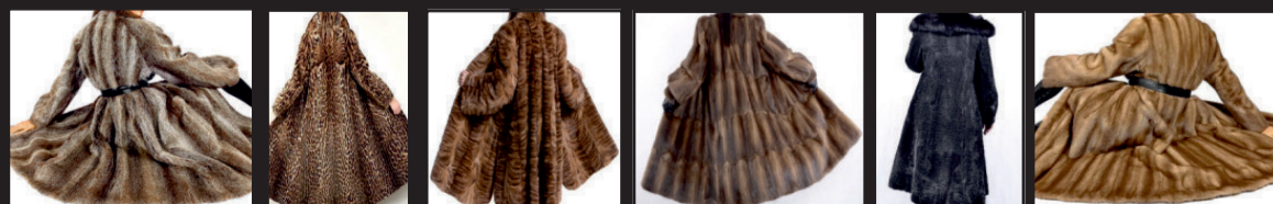
Bisam • Persianer • Fuchspelze aller Art • Zobel • Nerze • Nutria • Chincilla

Wir zahlen bis zu 2.500,- €** für alte Gemälde, Tierpräparate, Porzellanpuppen, Kamin + Standuhren und Porzellan