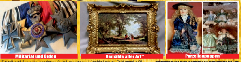
Militärat und Orden Gemälde aller Art Porzellanpuppen