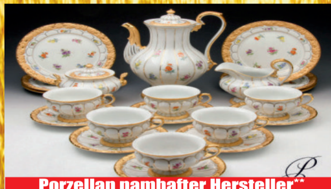
Porzellan namhafter Hersteller**