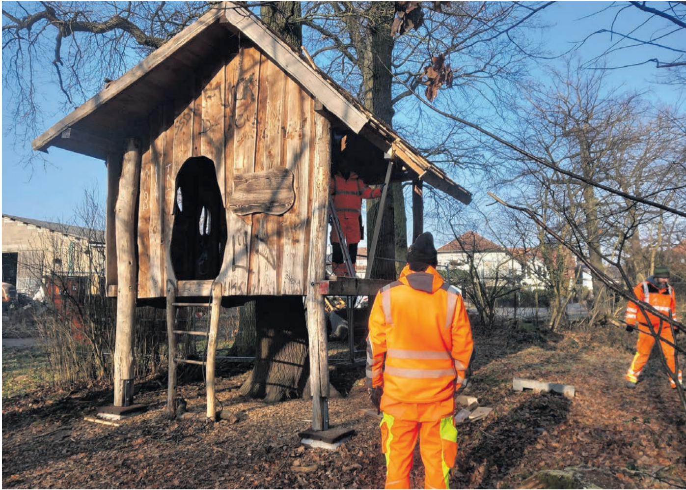
Das Bauhof-Team demontiert das Baumhaus im Sommerfeld.