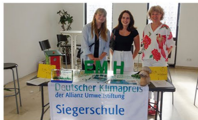
Das Team vom Schulzentrum Marienhöhe