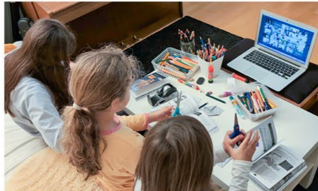
Kreative Gebetslesung über Paulus mit Schere und Buntstiften

Anfang und Ende der Reise erlebten wir sabbats gemeinsam in der zweiten Stunde des Gottesdienstes. Aber auch unter der Woche mussten die Kinder nicht alleine reisen. Wer konnte, traf sich virtuell via Zoom mit den anderen Kindern und wurde von einem Erwachsenen durch das jeweilige Kapitel geführt. In der Mitte der Woche trafen wir uns noch einmal live auf der Marienhöhe zu einem gemeinsamen Fackellauf. Rund 40 Kinder plus Eltern waren jeweils mit dabei.