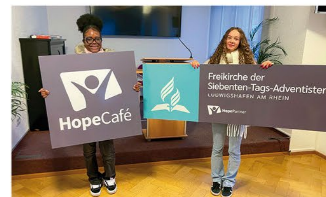
Gehören künftig zusammen: Hope Café und die Adventgemeinde