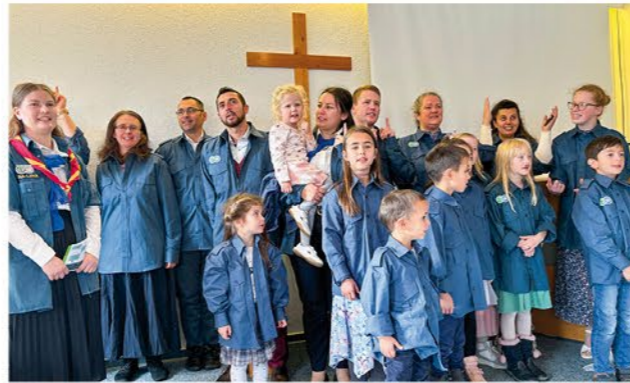
Die Pfadfinder der Adventgemeinde Schotten verbreiten gute Laune

Am 26. Oktober feierte die ehemalige Gruppe „Schotten“ gemeinsam mit den Nachbargemeinden des Bezirks nach 25 Jahren ihres Bestehens ihre offizielle Gemeindegründung. Etwa