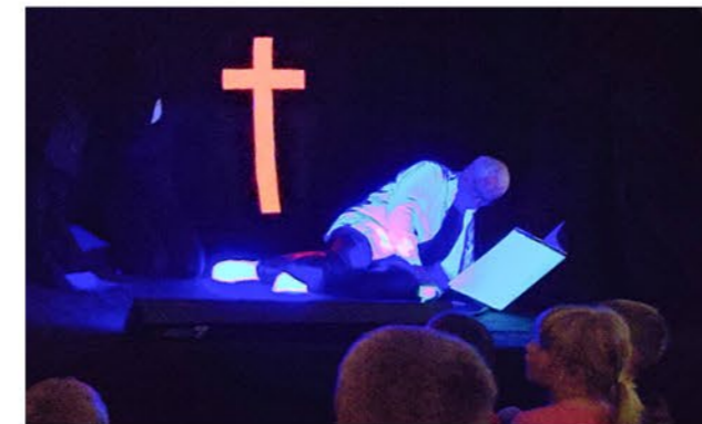
Luthers Geschichte im Theaterstück miterleben

Nach einem gemeinsamen Start mit Liedern gab es verschiedene Möglichkeiten, kreativ zu sein. An einer Station konnten die Kinder Reformationsbrötchen backen, an einer