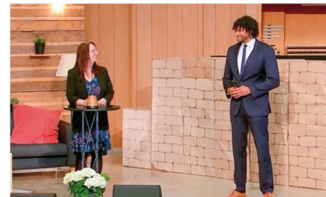
Vorträge und genug Raum zur Diskussion