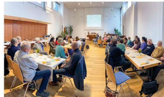
Nahrung für Körper und Geist