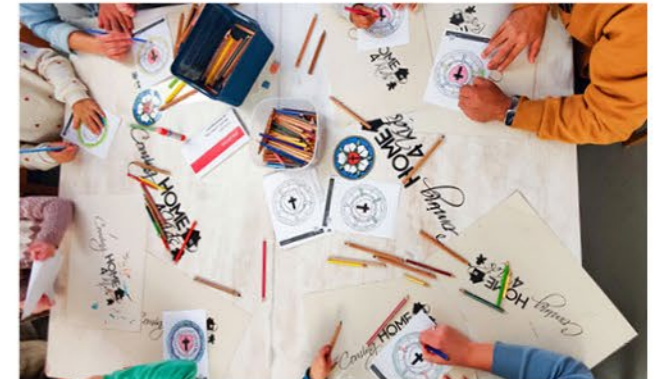
Stationen laden zum Kreativsein ein

Zahlreiche Lichterketten beleuchteten die Gemeinde, Snacks und Getränke waren bereitgestellt, die Bühne aufgebaut – alles war vorbereitet. Um 16:30 Uhr ging es dann endlich los, und nach und nach füllten viele Familien unser Gemeindehaus mit Leben.