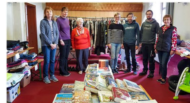
Spielsachen, Bücher, Kleidung – für alle ist etwas dabei

Wir freuen uns, dass unser Verschenkebasar in unserer Stadt und Umgebung immer mehr an Bekanntheit gewinnt, wir im-