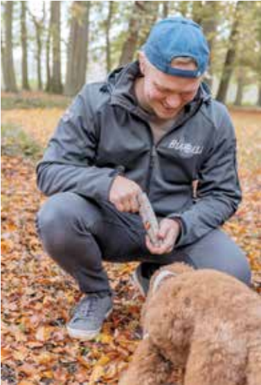
Die richtige Ernährung ist wichtig für Hunde.

Mit guter Ernährung die Abwehrkräfte des Vierbeiners stärken