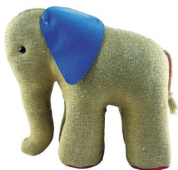
Von der DDR in die Welt

für Kinder. Die Ideen zur pädagogischen Früherziehung Friedrich Fröbels beeinflussten ihre Arbeiten