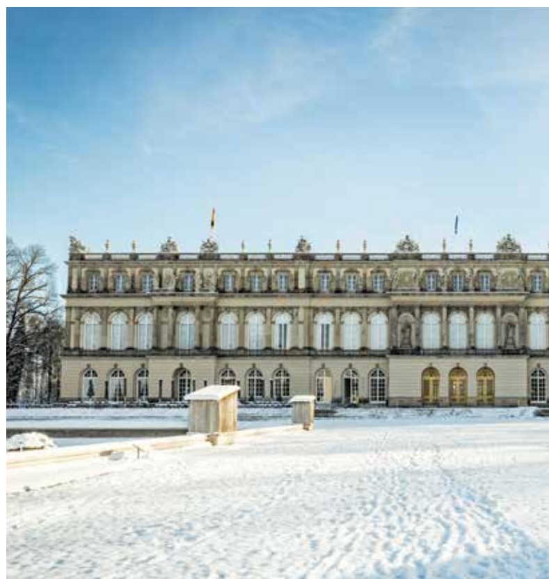
Schloss Herrenchiemsee gehört zum UNESCO-Welterbe und kann ganzjährig besichtigt werden. Mehr auf Seite 2.