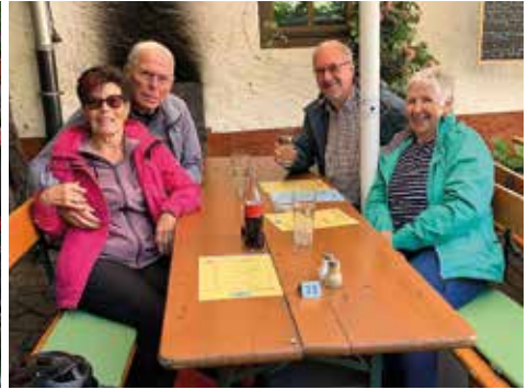
In der Straußwirtschaft Uriger Weinkeller

Der Rückweg führte uns über Nackenheim durch die herrlichen Weinberge bis Oppenheim. Dort fuhren wir mit der Fähre zum Kornsand und radelten weiter Richtung Braunshardt. Es hat allen sehr gut gefallen, sodass wir vorhaben das in 2026 zu wiederholen. Wir freuen uns schon auf viele schöne Fahrten im neuen Jahr und werden das Programm für 2026 im nächsten TSV Aktuell und auf der Internetseite mitteilen.