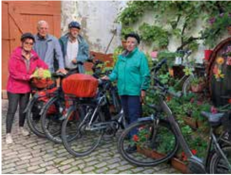
Ankunft in Bodenheim