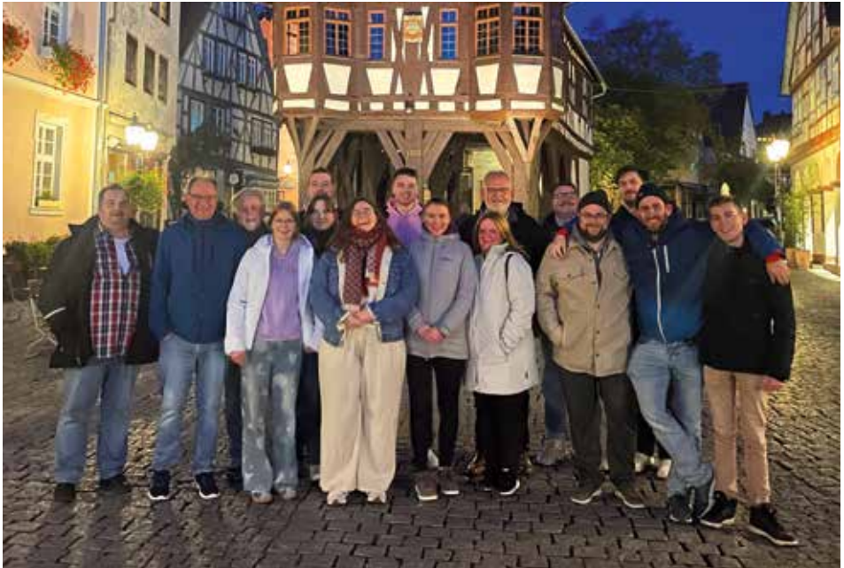
Blasorchester vorm alten Bürgerhaus der Stadt Michelstadt

als auch das moderne Stadtleben anschaulich zu verbinden. Die Gruppe zeigte großes Interesse an den Erzählungen und genoss den Rundgang durch die alten Gassen sehr.