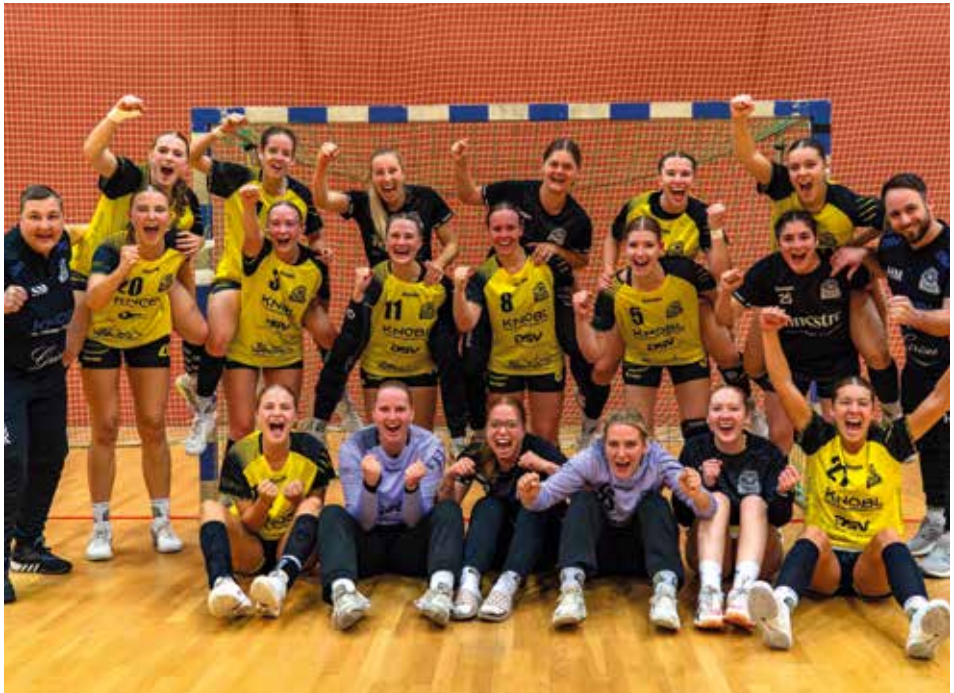
Sieg beim TSG Eddersheim

Gleich im ersten Spiel stand das heiß erwartete Spiel gegen die TSG Eddersheim auf dem Programm, das die Damen mit einem 24:26 für sich entscheiden konnten. Auch die fünf weiteren Spiele, unter anderem gegen hoch gehandelte Mannschaften aus Fritzlar (derzeit 4. Tabellenplatz), Kleenheim und Gedern/Nidda (derzeit 3. Tabellenplatz) gewannen die Damen 1 problemlos. Dieser phantastische Start macht Lust und Freude auf mehr. Wir sind gespannt, wo die Reise in diesem Jahr hingehen kann.