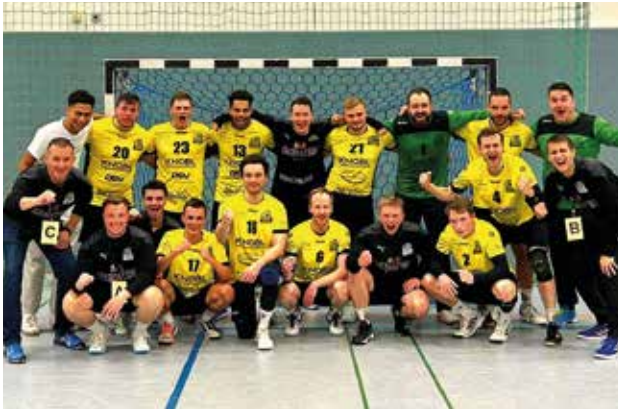
Herren 1 beim Spiel in Langen

Mit einer starken Leistung sind auch die Herren 1 nach dem Aufstieg in ihre erste Bezirksoberligasaison gestartet. Bereits die ersten beiden Spiele gegen Roßdorf und Heppenheim konnten die Herren durch eine starke Mannschaftsleistung und gutes Tempospiel für sich entscheiden. Im dritten Spiel gegen die 2. Mannschaft der HSG Groß-Bieberau/Modau reichte es nicht für einen Sieg. In den beiden darauffolgenden Spielen gegen Langen und Fürth/Krumbach brachten die Herren ihre Leistung dann wieder auf die Platte und konnten die nächsten vier Punkte auf dem Habenkonto verbuchen. Gegen eine spielstarke Erbacher Mannschaft kassierten die Herren eine 47:38 Niederlage. Ende Oktober finden sich die Herren damit mit 8:4 Punkten im oberen Tabellendrittel wieder. Eine beachtliche Leistung für den Aufsteiger.