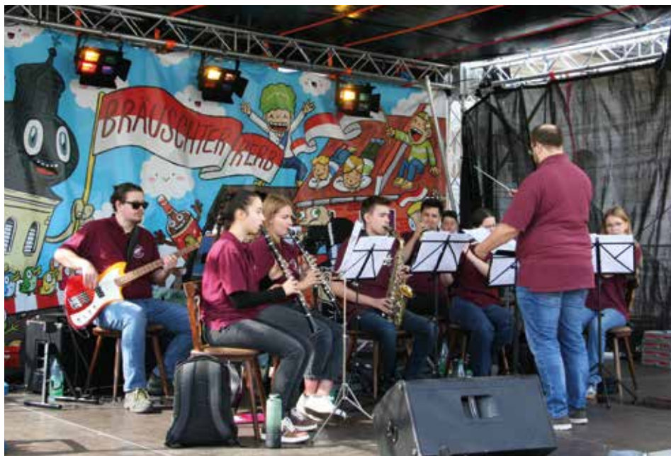
Jugendorchester auf der Bräuschter Kerb