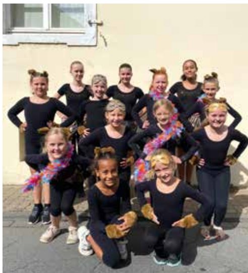
Mini-Garde & Konfettigirls

Der Kerwe-Vadder und die Zuschauer applaudierten und es gab Zugabe und Standing Ovations.