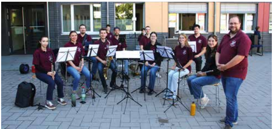
Jugendorchester beim Sommerfest der Astrid-Lindgren-Schule

Das erste Konzert nach der Sommerpause gestaltete das Jugendorchester, das am 12.09.2025 im Rahmen des Schulfests der Astrid-Lindgren-Schule auftrat. Die Kinder bewegten sich während der Darbietungen neugierig zwischen den