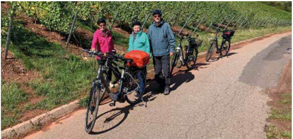
Von Bodenheim bis Oppenheim durch die Weinberge

Leider ist die Radsaison für das Jahr 2025 schon wieder zu Ende. Wir sind viele schöne Freitags-Abendtouren und Sonntags-Tagestouren geradelt. Die letzten Touren der Saison gingen zum Weingut Diez in Oppenheim, zur Thomashütte Eppertshausen, nach Bodenheim in den Urigen Weinkeller und zum Guglhupf nach Egelsbach und es hat wieder sehr viel Spaß gemacht. Vielen Dank allen Radwanderführern, die wie immer sehr schöne Strecken ausgesucht hatten. Die Radtour nach Bodenheim mit 65 km war zusammen mit der Fahrt zur Flörsheimer Warte die längste in diesem Jahr.