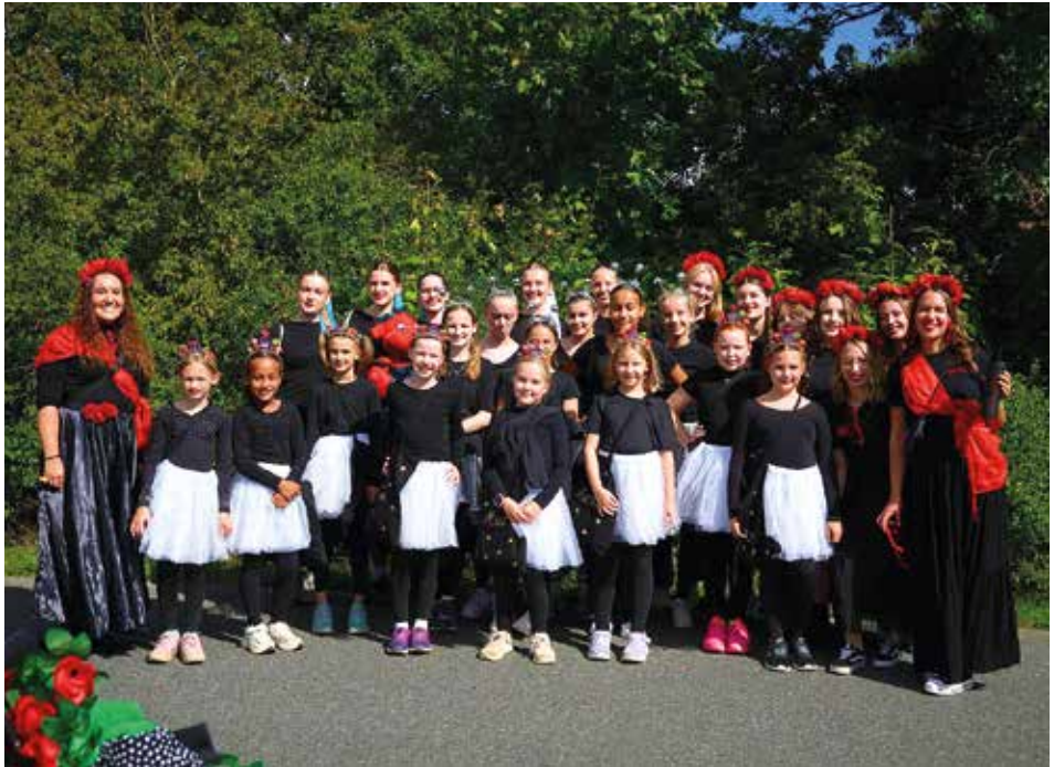
Unsere Garden beim diesjährigen Kerweumzug

Am Kerbsonntag waren die Garden zudem beim traditionellen Kerweumzug mit dabei.