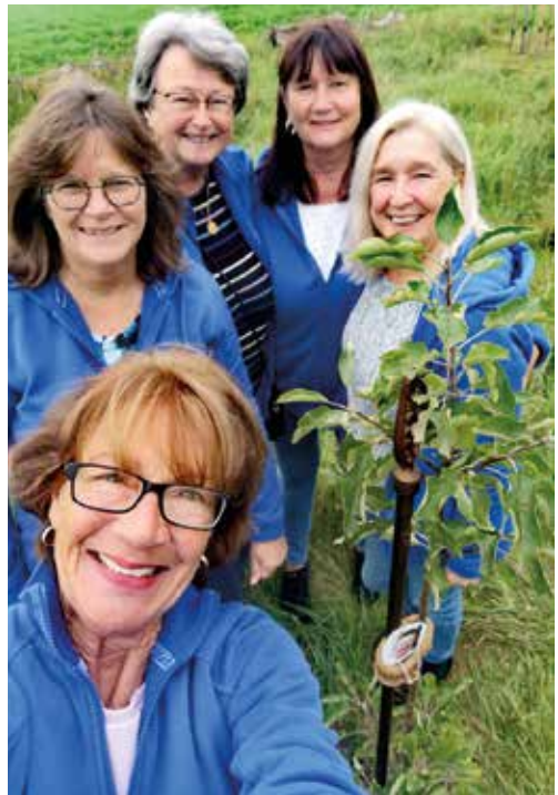
TSV Jazz-Frauen mit ihrem Apfelbaum

Die Altherrenmannschaft unserer Fußballer wurde von den Gräfenhäuser Altherren nominiert. Sie haben ihren Baum am Sportplatz