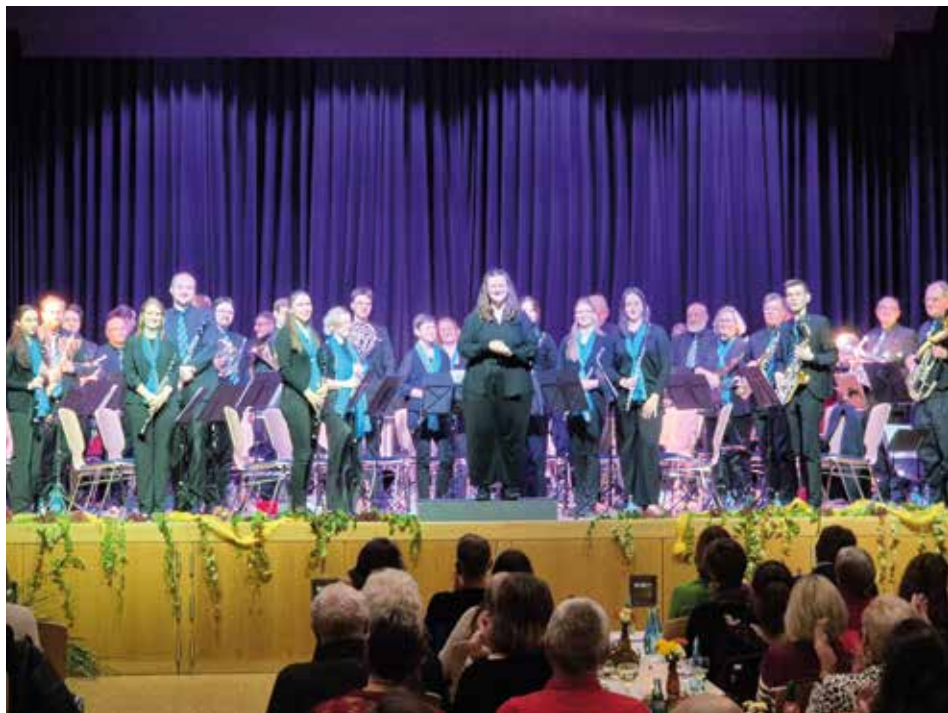
Blasorchester beim Jahreskonzert

Die Abteilung Blasorchester möchte sich bei allen HelferInnen für die Unterstützung bedanken!