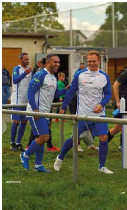
Freude nach dem Sieg

3:6, hätte aber viel höher siegen müssen. Das nächste Heimspiel gegen die Darmstädter TSG II wurde wieder unglücklich mit 0:1 verloren. Einem hart erkämpften 1:0 Heimsieg gegen SV Erzhausen II folgte eine Auswärtsniederlage beim Tabellenzweiten SV Schneppenhausen (4:0). Gegen den bis dahin ungeschlagenen Tabellenführer SV St. Stephan Griesheim II zeigte das Team, was in ihm steckt und möglich ist, wenn man kämpferisch engagiert, taktisch klug und mit dem nötigen Glück agiert. Der 1:0 Heimsieg war eine große Überraschung, doch im letzten Spiel vor Redaktionsschluss dieser Ausgabe, zeigte die Mannschaft dann wieder, wie es nicht geht. Stark ersatzgeschwächt verlor man bei SV Darmstadt 98 III mit 4:1.