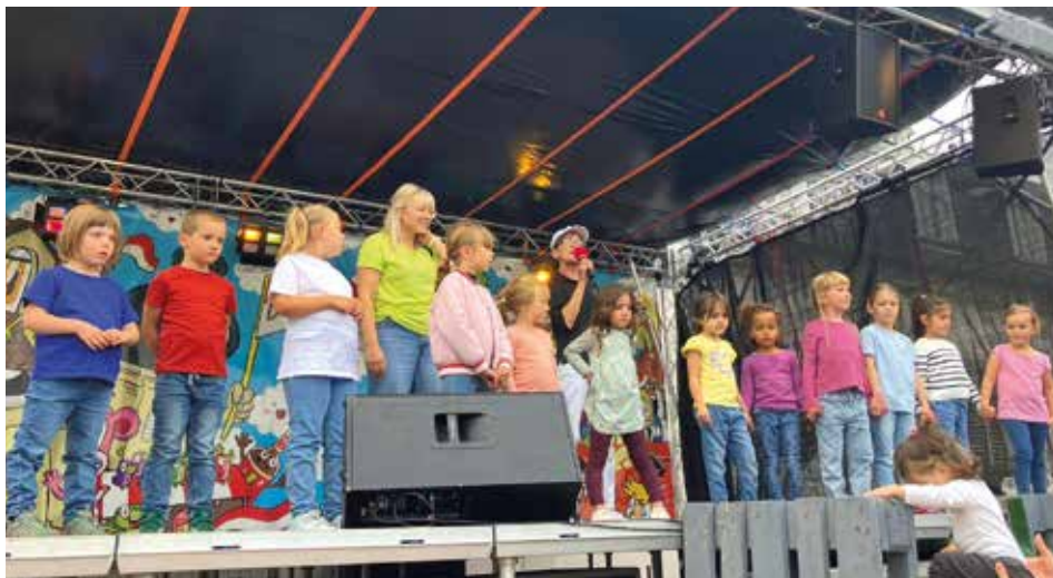
Die Happy-Flames auf der Bräuschter-Kerb-Bühne