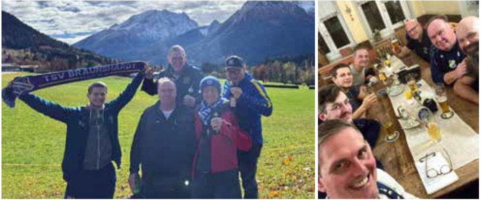
Ausflug nach Wasserburg am Inn

Die Tradition „Schal hoch für den TSV“ wurde auch in diesem Quartal wieder sehr ernst genommen. Viele TSV AH Kicker und deren Frauen ließen es sich nicht nehmen, Grüße aus aller Welt in unsere WhatsApp Gruppe zu senden und die Verbundenheit zum TSV überall im In- und Ausland zu präsentieren.