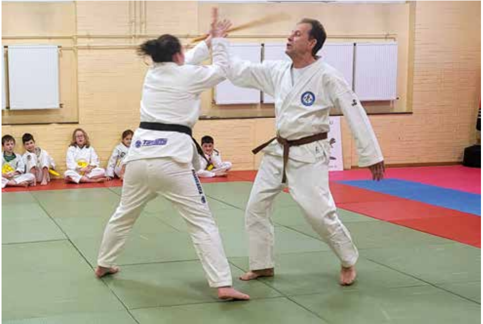
Die Abwehr von Schlägen, z.B. mit einem Stock, ist nur ein Aspekt beim Ju-Jutsu

Auch in unserer Abteilung steht diese Vielseitigkeit im Mittelpunkt. Ju-Jutsu vereint Schlag-, Tritt-, Wurf- und Bodentechniken, aber ebenso Werte wie Fairness, Respekt und Selbstbeherrschung. Ob jung oder alt, Einsteiger oder Fortgeschrittene – jeder kann bei uns trainieren, seine Fitness verbessern und lernen, sich selbst zu verteidigen. Dabei legen wir großen Wert auf ein gemeinschaftliches Miteinander und darauf, dass der Spaß am Training nicht zu kurz kommt.