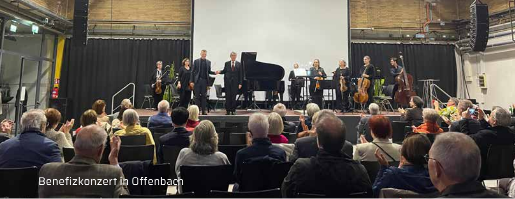
Benefizkonzert in Offenbach