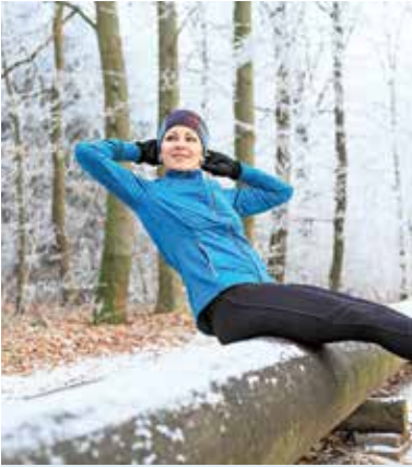
Mehr Sport treiben gehört zu den beliebtesten Gesundheitsvorsätzen der Deutschen. Also am besten gleich loslegen.

Civey-Umfrage zeigt: Mit steigendem Alter wächst das Gesundheitsbewusstsein