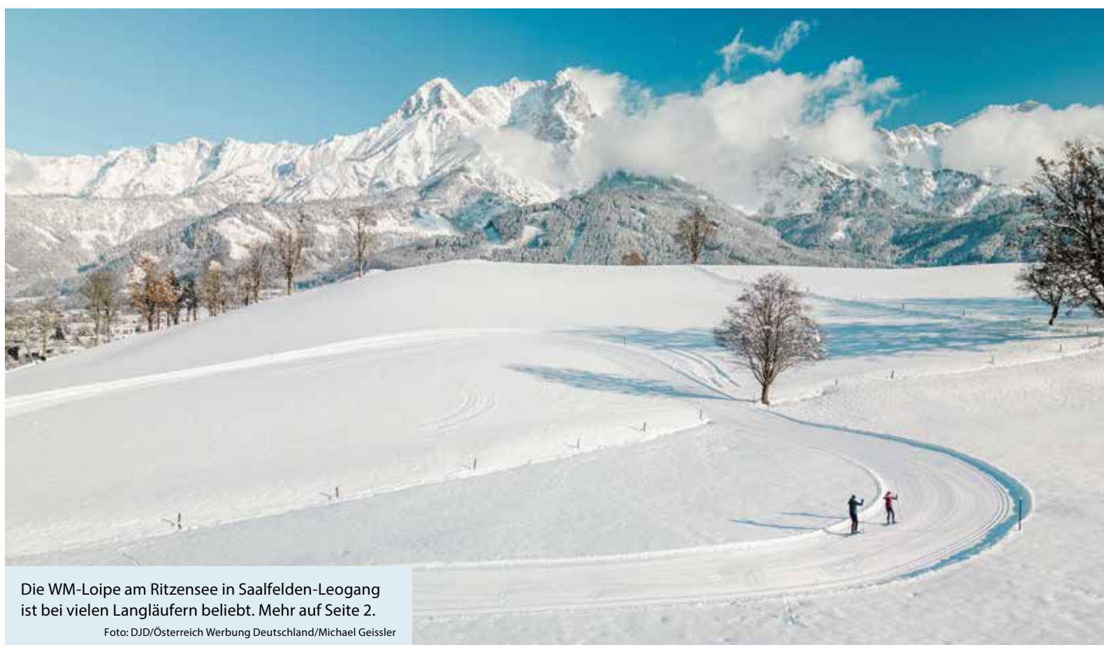
Die WM-Loipe am Ritzensee in Saalfelden-Leogang ist bei vielen Langläufern beliebt. Mehr auf Seite 2.