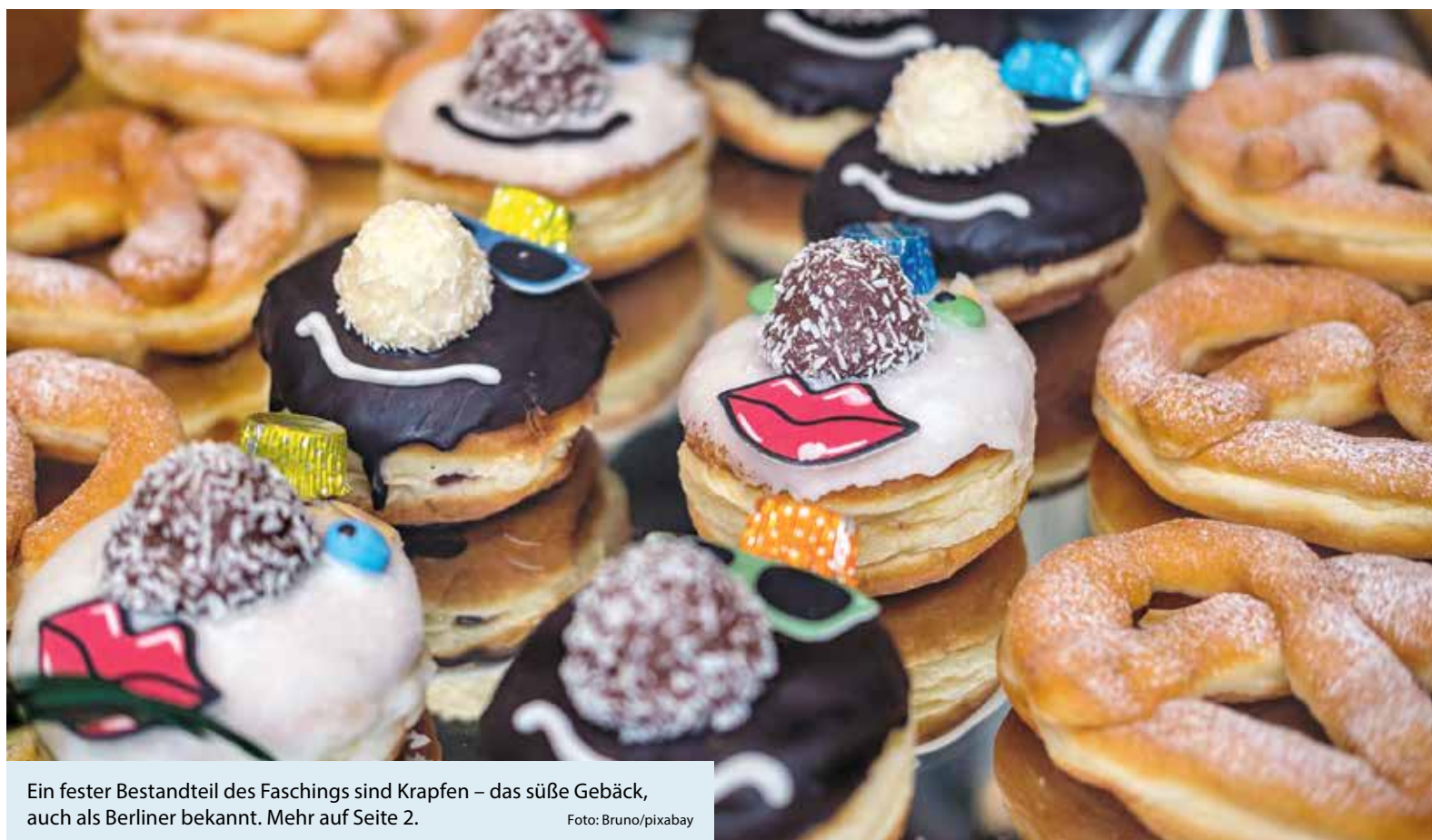
Ein fester Bestandteil des Faschings sind Krapfen – das süße Gebäck, auch als Berliner bekannt. Mehr auf Seite 2.