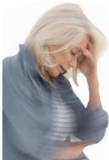
Abbildung Betroffenen nachempfindend, Namen geändert

TAUMEA, Wirkstoffe: Anamirta cocculus Dil. D4, Gelsemium sempervirens Dil. D5. TAUMEA wird angewendet entsprechend dem homöopathischen Arzneimittelbild. Dazu gehört: Besserung der Beschwerden bei Schwindel. • Zu Risiken und Nebenwirkungen lesen Sie die Packungsbeilage und fragen Sie Ihre Ärztin, Ihren Arzt oder in Ihrer Apotheke. • PharmaSGP GmbH, 82166 Gräfelfing