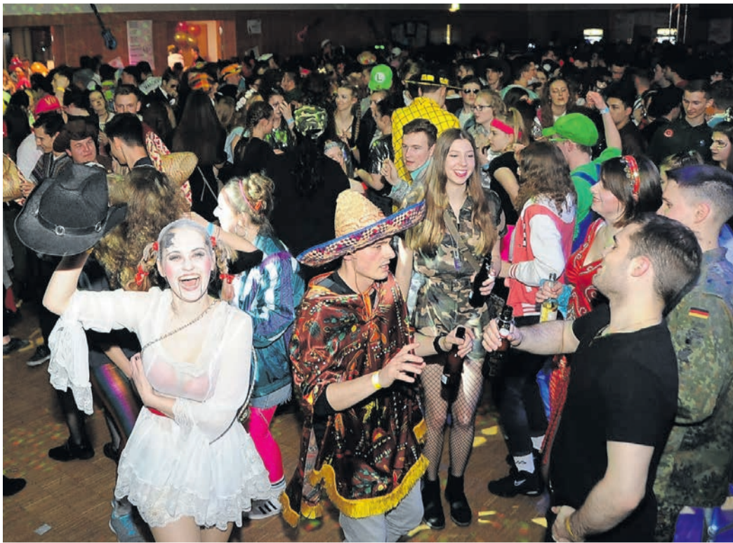
Der Settchesball ist die größte Veranstaltung der Kolpingsfamilie Eppertshausen. Zur 53. Auflage am 15. Februar passen die Organisatoren das Konzept an. So geht es nun früher los und die Settchen tanzen gleich zweimal.