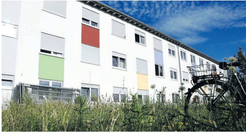
Aufgelöst: Im Dezember endete die Nutzung dieser (direkt neben dem Frankenbach-Gelände gelegenen) Immobilie in der Münsterer Goebelstraße als Flüchtlingsunterkunft. Auch in der sozialen Betreuung hat sich zum Jahreswechsel etwas geändert: Die Zuständigkeit ist von der Gemeinde auf den Landkreis übergegangen.

Münster (jedö) Die Gemeinde Münster hat die soziale Betreuung der im Ort lebenden Flüchtlinge zum Jahreswechsel an den Landkreis Darmstadt-Dieburg abgegeben. Zugleich wurde mit dem Objekt in der Goebelstraße die zweite große Münsterer Flüchtlingsunterkunft aufgelöst. In ihrem Bestreben, anerkannte und noch arbeitslose Asylbewerber in gemeinnützigen Tätigkeiten unterzubringen, müssen die Münsterer CDU und FDP nun ebenfalls auf den Kreis statt aufs Rathaus hoffen.