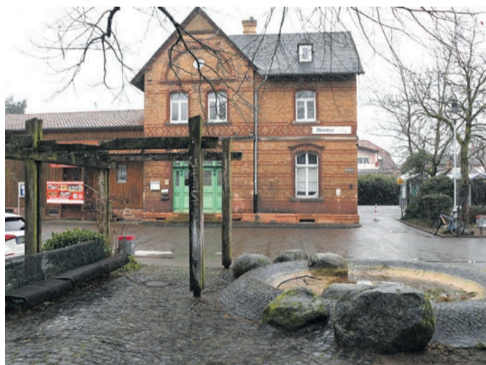
Das Wetter hat die Tiefbau-Arbeiten am Münsterer Bahnhofsvorplatz verzögert. Ursprünglich sollten sie noch im Dezember beginnen. Unter anderem der Brunnen (im Bild) soll rückgebaut werden.

Münster (jedö) Unter den vielen Münsterer Bauvorhaben, die in diesem Jahr durchgeführt oder zumindest begonnen beziehungsweise geplant werden sollen, taucht das Wort „Bahnhof“ gleich zweimal auf – ohne dass sich an den Gleisen, Bahnsteigen oder dem alten Bahnhofsgelände im Westen des Ortsgebiets selbst etwas ändern würde. Vielmehr sollen der Bahnhofsvorplatz und die nahe Bahnhofstraße ein neues Antlitz bekommen. Ein Überblick zu mehreren Projekten.