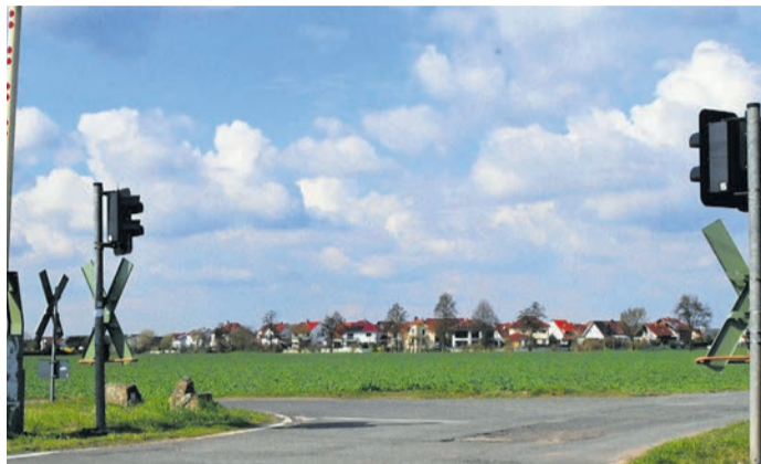
Blick aus Süden aufs Münsterer „Insel-Viertel“. Dort wurde 2024 besonders viel Kritik laut, als die Gemeinde allen Grundstücks-Eigentümern im Ort die Neuberechnung der Niederschlagswasser-Gebühren ankündigte. Die ist inzwischen gescheitert, alle erhobenen Daten wurden vernichtet. Nun hat auch der Akteneinsichts-Ausschuss der Gemeindevertretung seine Arbeit beendet.

Schon im Herbst 2024 erntete das Rathaus für die Durchführung des Verfahrens jedoch viel Kritik von Gemeindevertretern (besonders von der CDU) und Bürgern. Die Datenerhebung per Drohnenüberflug in recht niedriger Höhe samt scharfer Fotos der Grundstücke in Münster, Altheim und Breitefeld wurde dabei besonders deutlich verurteilt. Die Union war sich schon damals sicher, dass dies erhebliche Verstöße gegen das Persönlichkeitsrecht und die Datenschutz-Grundverordnung dargestellt habe. Tatsächlich herrscht dazu aber bis zum heutigen Tag noch keine Klarheit, weil der Hessische Datenschutzbeauftragte schon seit vielen Monaten eine Ant-