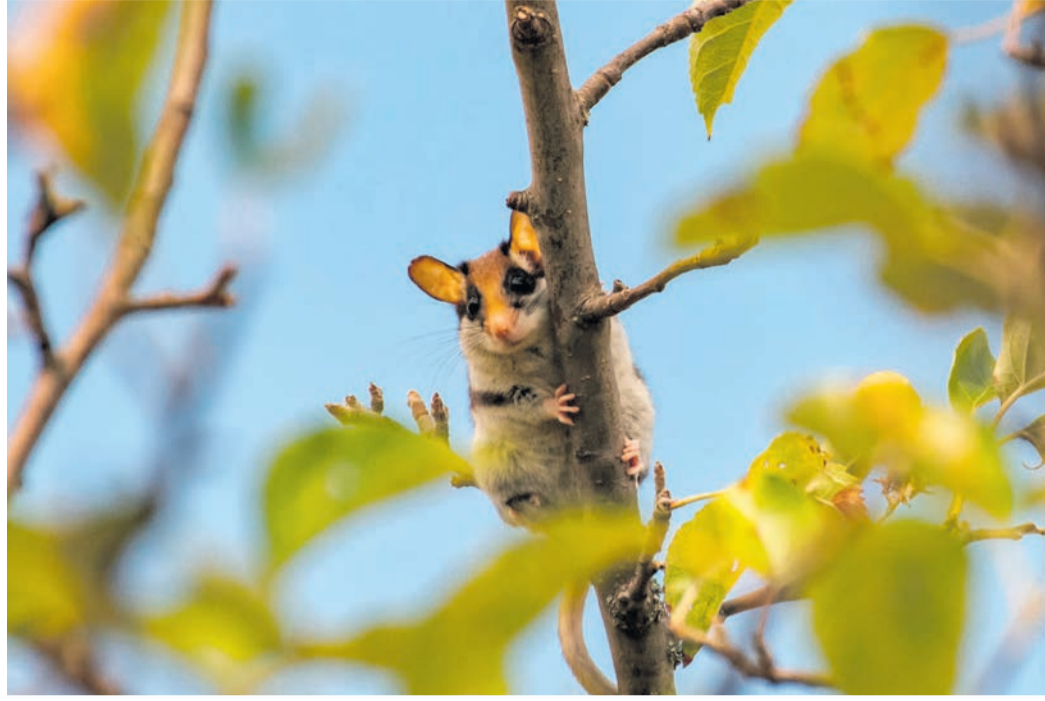
Der Gartenschläfer in seiner natürlichen Umgebung.