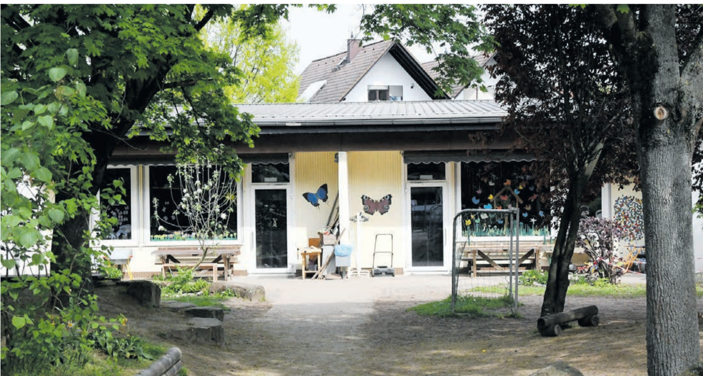
Die Tage der alten Münsterer Kita St. Michael sind gezählt. Im Sommer soll sie abgerissen und danach an selber Stelle in der Gerhart-Hauptmann-Straße neu gebaut werden. Aktuell startet die Interimsphase der Einrichtung im Baugebiet „Am Seerich“, wo eine Containeranlage errichtet worden ist.