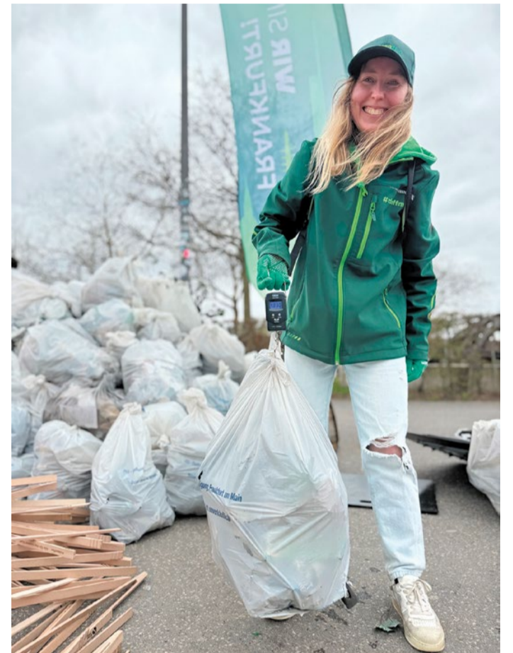
Frankfurt Cleanup 2025, zentrale Aktion Hafepark.

Organisiert wird die Aktion von der FES und der Stabsstelle Sauberes Frankfurt mit Unterstützung des Grünflächenamtes. Am Freitag, 20. März, und Samstag, 21. März, sind Cleanups in den Stadtteilen geplant. Zusätzlich finden am Samstag, 21. März, die zentrale Aktion von 11 bis 14 Uhr im Hafepark statt.