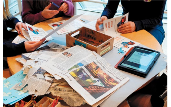
Fake News am Beispiel des Klimawandels: Schülerinnen der Elisabethenschule im Workshop.

wissen. Ziel war es, kritisches Denken zu fördern und den Umgang mit Informationen in digitalen Medien zu stärken. Weitere Bildungsangebote zur Demokratie- und Medienkompetenz sollen folgen.