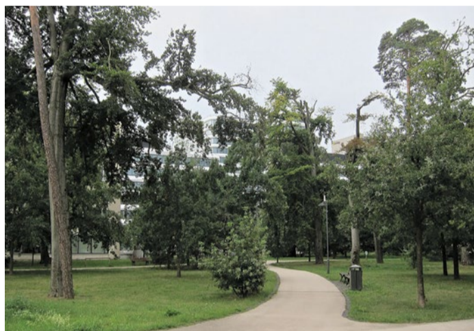
Moderne Architektur trifft grüne Pausen: Park und Ruheflächen im Quartier.

auf Größe, sondern auf Qualität. Großzügige, helle Hallen, optimierte Abläufe und digitale Infrastruktur sorgen für reibungslose Wege. In der Check-in-Halle schwebt mit „The First, the Last, Eternity“ von Julius von Bismarck eine Installation, die Bewegung sichtbar macht.