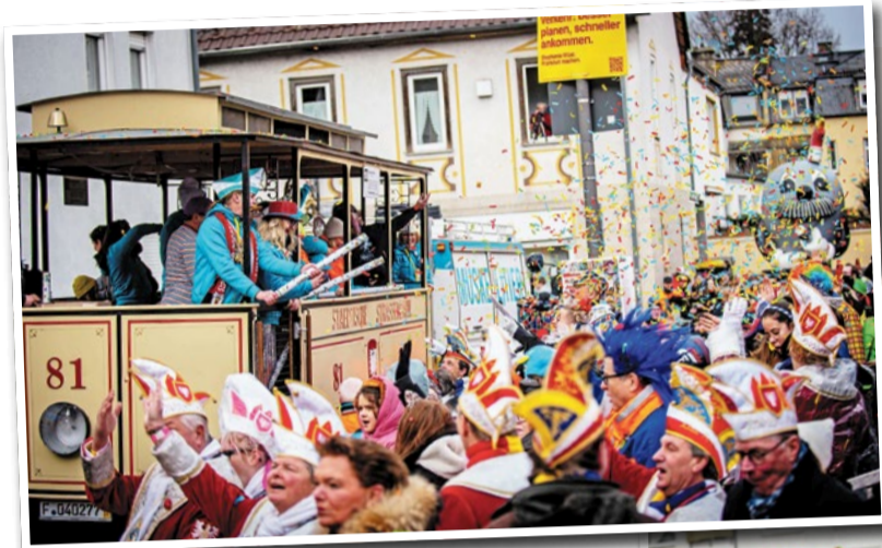
Gute-Laune-Impressionen vom Umzug

Ob Teilnehmer, Helfer oder Publikum – alle waren sich einig: In Klaa Paris geht es weniger ums Trinken, sondern vor allem um Freude, Gemeinschaft und gelebte Fastnachtskultur.