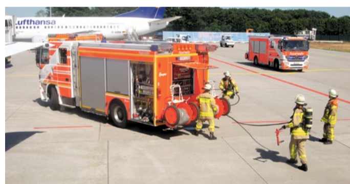
Einsatzbereit rund um die Uhr: Die Flughafenfeuerwehr

als grüne Pause zwischen Büro und Terminal. Internationale Unternehmen residieren in markanter Architektur, Hotelgäste wechseln nahtlos zwischen Meeting und Abflug, Pendler schätzen die kurzen Wege. Und im Sommer zeigt das Viertel eine überraschend entspannte Seite: Der Gateway Gardens Ocean Club bringt Strandatmosphäre an den Airport. Liegestühle, Beats, After-Work-Drinks – ein Ort, an dem sich Business und Barfußgefühl treffen. Gateway Gardens ist kein Wohnviertel im traditionellen Sinn, sondern ein durchdachter Möglichkeitsraum – schnell, vernetzt, effizient und erstaunlich lebenswert.