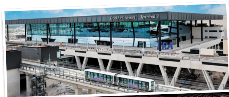
Das neue Terminal steht kurz vor der Eröffnung

Ein Quartier, das aus einer ehemaligen US-Militärsiedlung hervorgegangen ist und heute auf rund 35 Hektar moderne Arbeitswelten, Hotels, Gastronomie und grüne Aufenthaltsflächen bündelt. Klassische Wohnungen suchen man hier bewusst vergeblich – der Fluglärm setzt klare Grenzen. Stattdessen ist ein lebendiges Business- und Servicezentrum entstanden: mit direktem S-Bahn-Anschluss, Restaurants, Supermarkt, Kitas und einem großen Park