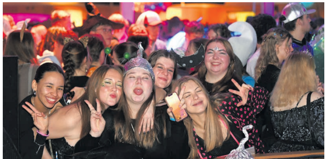
1.000 Besucher kamen am Sonntagabend auf den ausverkauften 53. Eppertshäuser Settchesball. Erneut dominierten jüngere Gäste, doch auch die älteren Generationen begrüßte die Kolpingsfamilie wieder verstärkt.

Applaus für die Settchen: Die mittlerweile 35 Frauen und Männer große Eppertshäuser Tanzgruppe trat auf dem 53. Settchesball gleich zweimal auf.