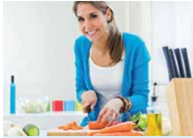
Eine pflanzenbetonte, basische Ernährung kann bei rheumatoider Arthritis als Begleittherapie die Beschwerden lindern.

Ursache ist ein Angriff des Immunsystems auf körpereigene Strukturen. Heilen lässt sich die Erkrankung bislang nicht, doch Therapien und Medikamente können das Fortschreiten bremsen und die Beschwerden lindern. Viele Betroffene wünschen sich jedoch mehr