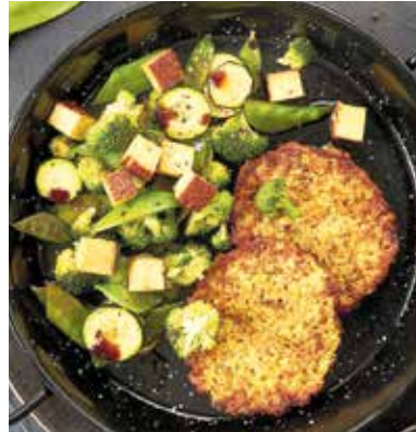
Die krossen Gemüsetaler mit Pfannengemüse und Tofu sind im Nu zubereitet.

(DJD). Wenn Kinder mit am Tisch sitzen, kann das gemeinsame Essen schonmal zur Herausforderung werden: Viele Eltern legen Wert auf Gerichte, die gesund sind und eine bewusste, pflanzenbetonte Ernährung unterstützen. Vegane Mahlzeiten haben daher längst ihren Platz in der Familienküche gefunden. Kinder stehen diesen erstmal oft skeptisch gegenüber. Doch dafür gibt es bei diesem Gericht gar keinen Grund: Die Gemüsetaler aus Kartoffeln sind knusprig-heiß, voller Aroma und überzeugen auch kleine Esser. Der Gemüsetaler ist mit Zwiebeln, Karotten und Sellerie verfeinert. Räuchertofu in der Beilage sorgt für den Umami-Geschmack. Und das Beste: Die Taler gibt es pfannenfertig zu kaufen und sind in wenigen Minuten bereit zum Wegknuspern. Man kann sie in der Pfanne, im Backofen, in der Heißluftfritteuse oder sogar auf dem Grill zubereiten.