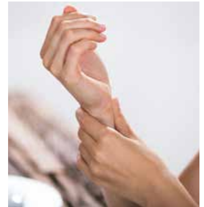
Rheuma macht sich durch schmerzende, steife und geschwollene Gelenke bemerkbar.

ken. Orientierung und eine Liste empfohlener Nahrungsmittel finden Interessierte etwa unter www.basica.com . Generell gilt eine mediterrane, pflanzenbetonte Kost als entzündungshemmend und kann die Beschwerden bei Rheuma reduzieren.