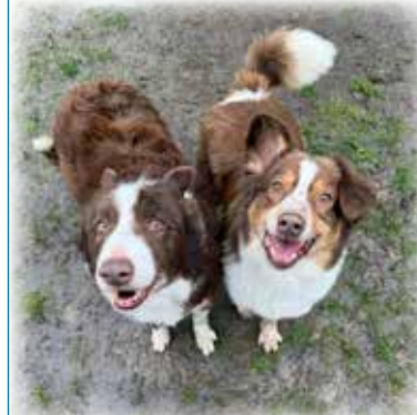
TIM UND STRUPPI

Tiere in Not Odenwald e.V. | Tel. 06063/939848 www.tiere-in-not-odenwald.de