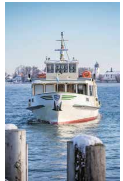
Die Chiemsee-Schiffe bringen Besucher das ganze Jahr über zu den Inseln im „Bayerischen Meer“.

steht die heimische Vogelwelt im Fokus. An der Einmündung der Prien in den Chiemsee führt eine spannende Bibertour die menschlichen Besucher in die Arbeits- und Lebensweise der fleißigen „Landschaftsgärtner“ und die Bauweise ihrer Burgen ein. Wer sich dagegen zusammen mit tierischen Begleitern auf den Weg durch die Winterlandschaft machen möchte, kann in Bernau geführte Alpaka-wanderungen unternehmen.