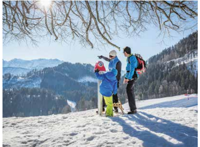
Winterliche Ausblicke lassen sich vom Erlebnisberg Oberaudorf-Hoheck genießen.

Einen winterlichen Besuch wert ist auch die Nachbarinsel Frauenchiemsee mit dem ältesten Nonnenkloster Deutschlands, Bauernhäusern, Fischereibetrieben, Töpfereien und Künstlerateliers. Ein Rundgang führt Besucher