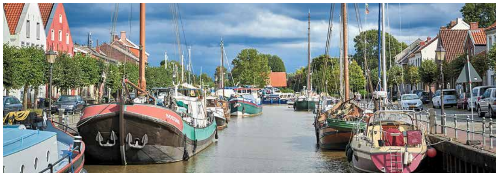
Neben gut ausgebauten Radwegenetzen locken auch gemütliche kleine Orte wie hier am alten Hafen von Weener zu Entdeckungstouren. Mehr auf Seite 2.

Moin Weite. Moin Ruhe. Moin Ostfriesland. Rad, Kanu und Gastfreundschaft im südlichen Ostfriesland