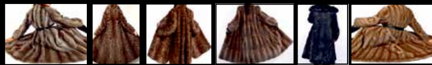
Bisam • Persianer • Fuchspelze aller Art • Zobel • Nerze • Nutria • Chincilla

Tel.: 06104 - 670 79 40 Kantstr. 38 - 63150 Heusenstamm