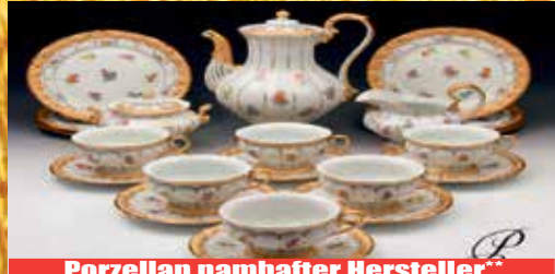
Porzellan namhafter Hersteller**