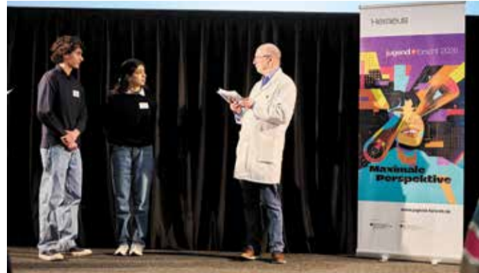
„Jugend forscht“ Rhein-Main hat zwei Siegerteams der Phorms Schule Frankfurt im Rennen um die Landesehre.

Müll. Das Schülerteam zeigt, wie organische Reststoffe sinnvoll zur Energiegewinnung genutzt werden können. Für ihre Arbeit erhielten sie einen ersten Platz in Biologie sowie einen dritten Platz in Technik und qualifizierten sich für das Landesfinale in Darmstadt im März.