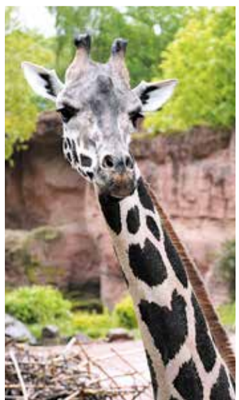
Giraffe Niobe kam aus dem Erlebnis-Zoo Hannover nach Frankfurt.

OSTEND/ZOO (RED) | Nach dem Abschied von Giraffe BINE Anfang Februar hat der Zoo Frankfurt wieder zwei Langhalse: Am 26. Februar zog die elfjährige Nubische Giraffe NIOBE aus Hannover ein. Sie soll der zwölfjährigen Netzgiraffe SHUJAA Gesellschaft leisten, denn Giraffen sind soziale Tiere und werden nicht allein gehalten. Das Giraffenhäus ist derzeit nur zeitweise geöffnet, damit sich NIOBE in Ruhe eingewöhnen kann. Zooleitung und Stadt freuen sich über die schnelle, tierwohlgerichte Lösung. Langfristig plant der Zoo im Rahmen seines Masterplans eine neue, größere Savannenlandschaft für Giraffen und weitere afrikanische Tierarten.