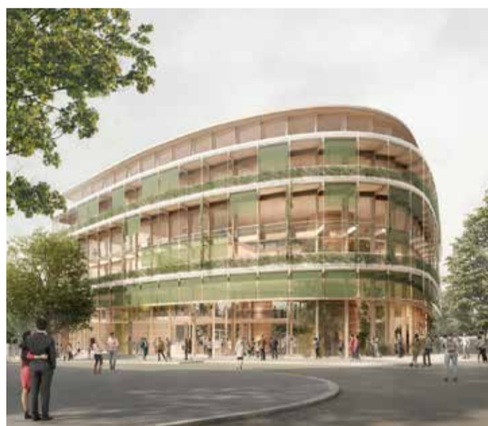
Gerenderte Ostansicht des ausgewählten Entwurfs aus Sicht der Waldschmidtstraße.