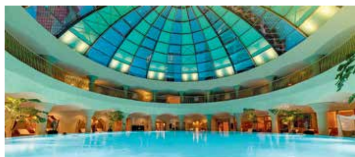
Hier lässt man Alltag und Kälte buchstäblich hinter sich.

Das LAGOM in der Pariser Str. 8 ist mehr als ein Café – hier verschmelzen Frühstück, Kaffee und entspanntes Beisammensein zu einem besonderen Erlebnis. Der Name ist Programm: lagom – nicht zu viel, nicht zu wenig, genau richtig. Minimalistisches Nordic-Design trifft auf warme Gastfreundschaft, wodurch der Raum zugleich gemütlich und stilvoll wirkt. Die Karte bietet fluffige Pancakes, frische Bowls, kreative Bagels und saftige Kuchen – perfekt, um den Tag zu starten oder zwischendurch einen ruhigen Moment zu ge-