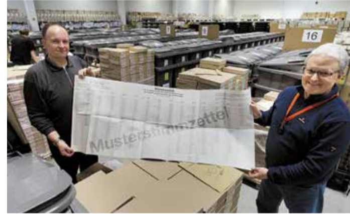
Mega-Stimmzettel vor Mega-Wahlvorbereitung für die Kommunalwahl.

Wahlbriefe werden geprüft und bis zur Auszählung sicher verwahrt. Eine Woche vor dem Wahltag beliefern täglich sechs Lkw die Wahlgebäude. Insgesamt werden 1.134 Urnen, Stimmzettel auf rund 90 Europaletten sowie umfangreiches Arbeitsmaterial verteilt. Rund 7.000 ehrenamtliche Wahlhelferinnen und Wahlhelfer sorgen am Wahltag und bei der anschließenden Auszählung für einen reibungslosen Ablauf. Auch nach dem 15. März bleibt die Halle gefüllt: Die Stimmzettel werden bis zur nächsten Wahl archiviert – und der Geruch nach Papier bleibt.