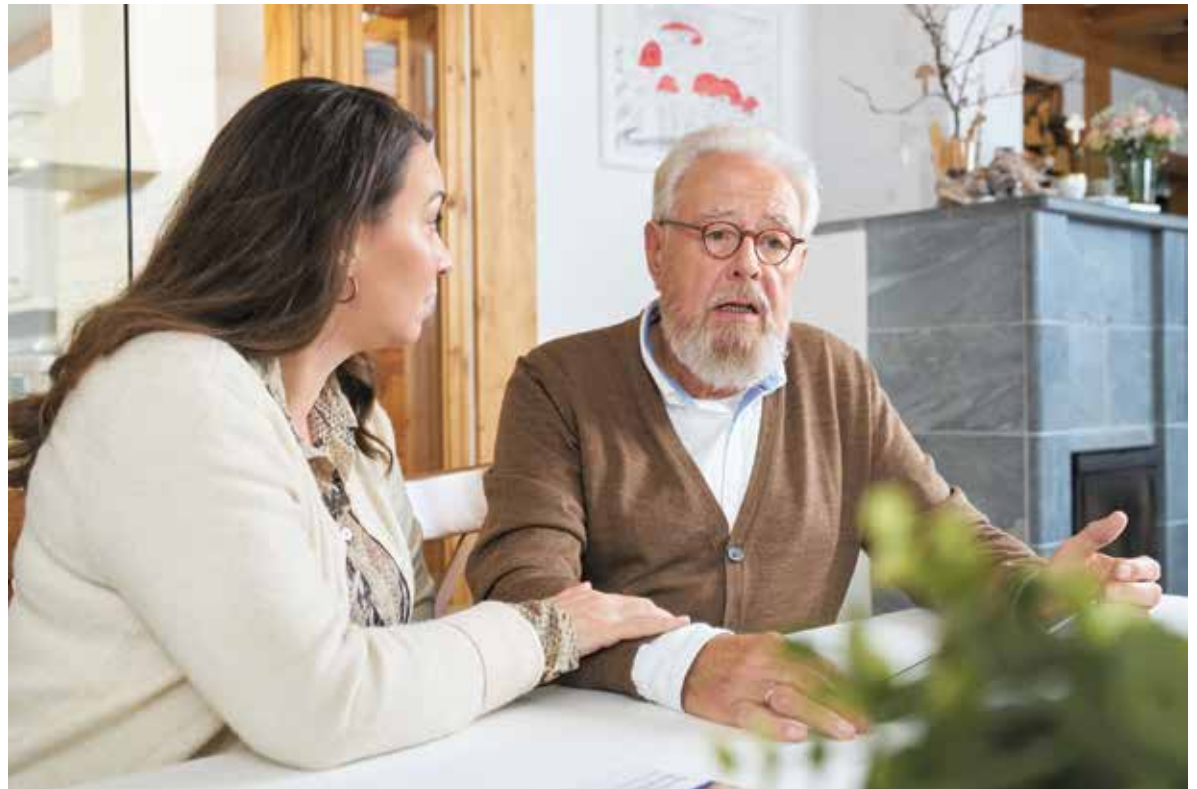
Pflegeberatung kann helfen, mit einer Demenzdiagnose besser umzugehen.

Oft sperren sich Betroffene jedoch gegen eine Untersuchung – zum Beispiel aus Scham oder Angst. „Dann sollten Angehörige das Thema immer wieder behutsam ansprechen. Es kann auch hilfreich sein, die Demenz nicht in den Vor-