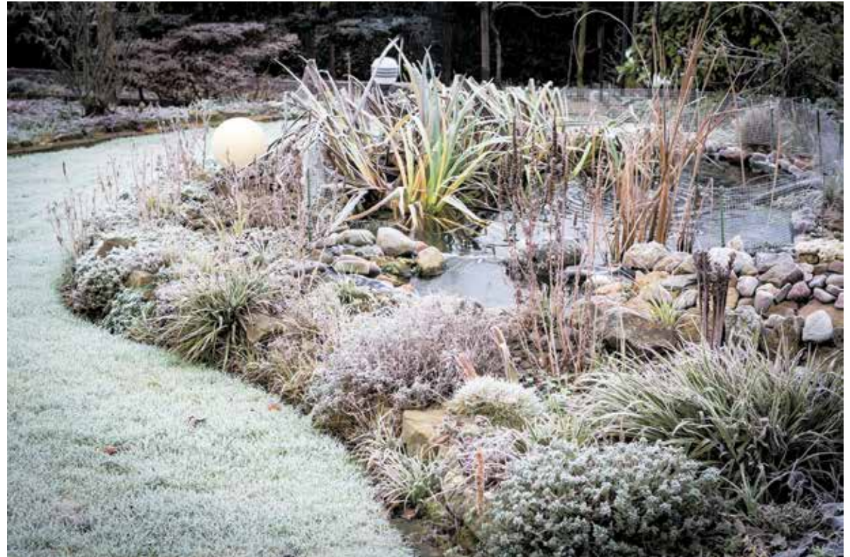
Mit den richtigen Pflegetipps kommt der Teich gut durch den Winter und ist auch an kalten Tagen hübsch anzuschauen.

Im Winter ziehen sich die Fische in die tieferen Teichebenen zurück. Ihr Stoffwechsel kommt weitgehend zum Erliegen, sie fallen in eine Art Winterstarre und essen nichts mehr. Doch Sauerstoff brauchen sie weiterhin. Gleichzeitig zersetzen sich Laub, Futterreste