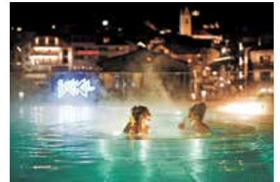
Nach einem sportlichen Skitag locken in Ischgl verschiedene Wellness-Angebote.

Am Ritzensee wird der Wintersport spielerisch. Im Nordic Park probieren Familien auf Schanzen, Wellen und Slalomkursen die schmalen Bretter aus. Kinder stürzen sich begeistert in die nordische Rätselralley, während geübte Läufer die Kollingwaldrunde oder die WM-erprobte Strecke am Ritzensee testen. Wenn die Eisfläche freigegeben ist, lädt der zugefrorene See zum Schlittschuhlaufen ein.