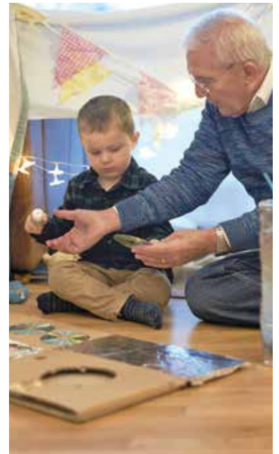
Gemeinsam Basteln und Spielen - dafür ist auch die ungestörte Kommunikation zwischen Alt und Jung wichtig.

Hilfreich ist es zudem, wichtige Gespräche in einer ruhigen Umgebung zu führen und den Blickkontakt zu halten, da Mimik und Lippenbewegungen das Verstehen zusätzlich erleichtern. Auch ein offenes Gespräch innerhalb der Familie kann helfen – Kinder dürfen wissen, dass Oma oder Opa manchmal etwas lauter oder deutlicher angesprochen werden müssen. Vor allem aber lohnt es sich, das Gehör regelmäßig überprüfen zu lassen, am besten alle paar Jahre. Denn Großeltern, die ihren Enkeln ein offenes Ohr schenken, stärken deren Vertrauen – und sichern sich selbst unvergessliche gemeinsame Momente.