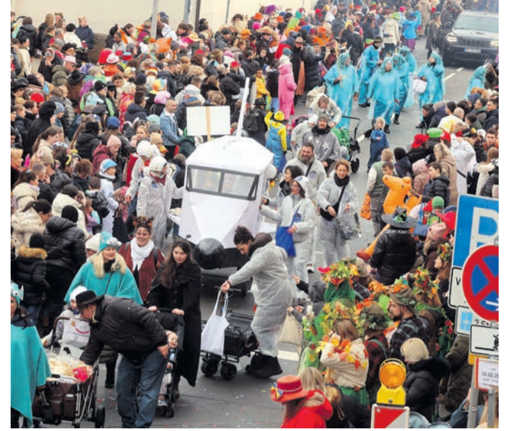
Die Kitas waren unter anderem mit einem Spaceshuttle auf den Umzügen unterwegs.

Werner Popp meldete 1460 Teilnehmer. 24 Vereine und Gruppen machten mit. Mit Untergruppen waren es 45