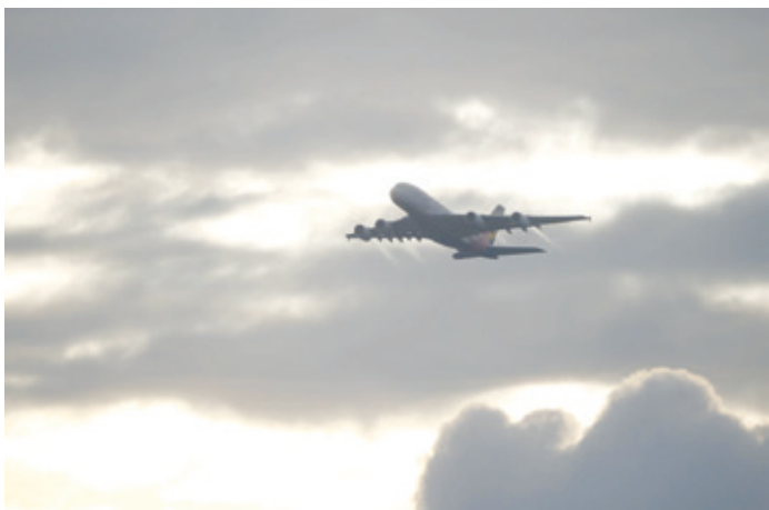
Eine vierstrahlige Maschine über Erzhausen macht viel Krach.

Wenn darüber diskutiert wird, wer den Fluglärm (und die giftigen Abgase) abbekommen soll, dann glaube ich, ich stehe im Wald. Ach nein, der Bannwald wurde ja gerodet für eine weitere Landebahn und für eine weitere Autobahnauffahrt, und für eine Garage für die richtig dicken Brummer.