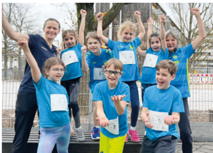
U10 als „Blaue Blitze“

Arheilgen (mh). Einen gelungenen Start in die neue Wettkampfsaison feierten die Nachwuchs-Leichtathleten der SG Arheilgen, die am vergangenen Wochenende gemeinsam mit der SV Erzhausen in einer Startgemeinschaft beim ersten Wettkampf der Saison 2026 in Langen antraten. Dieser Wettkampf bildete den Auftakt der Kinderleichtathletik-Liga und war der erste von insgesamt vier Terminen der Serie. Den Anfang