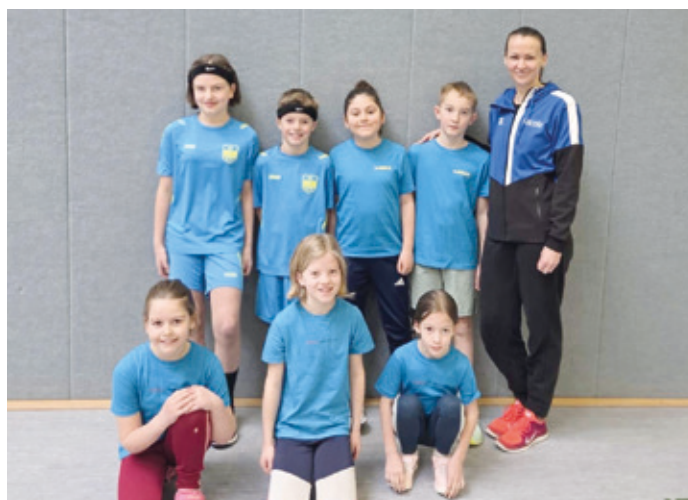
U12 als „Blue Sharks“

machten am Samstag die Athletinnen und Athleten der U10, die als „Blaue Blitze“ antraten. In den Disziplinen 35m-Sprint, 30m-Hindernis-Sprintstaffel, Hoch-Weitsprung und Medizinball-Stoßen zeigten die Kinder großen Einsatz und viel Freude an der Bewegung. Am Ende belegte das Team einen sehr guten 12. Platz unter 22 Mannschaften. Am Sonntag folgte die U12, die unter dem Teamnamen „Blue Sharks“ startete. In den