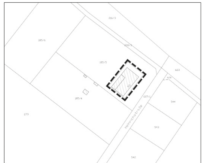
Geltungsbereich des Bebauungsplans „Die vier Morgen“.

Mit dieser Bekanntmachung tritt der Bebauungsplan „Sportgelände“ – 2. Änderung gemäß § 10 Abs. 3 BauGB in Kraft.