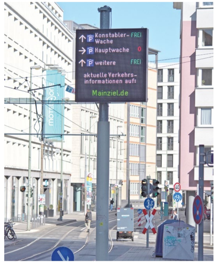
In der Weißfrauenstraße hat das Straßenverkehrsamt auf Höhe des Instituts für Stadtgeschichte eine Anzeigetafel errichtet.

Mobilitätsdezernent Wolfgang Siefert sieht darin einen wichtigen Schritt: „Zurecht haben mich viele Beschwerden erreicht, warum die Stadt das abgängige Parkleitsystem nicht schon vor