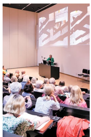
Kunstvorlesung am Uni-Campus Westend

FRANKFURT (RED) | Mit Beginn des Sommersemesters öffnet auch die U3L – Universität des 3. Lebensalters an der Goethe-Universität Frankfurt wieder ihre Türen für alle, die Freude am Lernen und am Austausch haben. Das besondere Studienangebot richtet sich an Menschen ab 50 Jahren, die sich wissenschaftlich weiterbilden, neue Themen entdecken oder sich mit anderen engagierten Lernenden austauschen möchten.