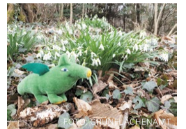
Das GrünGürtel-Tier wird in diesem Jahr 25 Jahre alt.

für alle‘ zeigen wir diesen besonderen Lern- und Erlebnisraum für die ganze Stadt“, sagte Zapf-Rodríguez. Der GrünGürtel werde damit erneut zum Lernort, Abenteuerspielplatz und Treffpunkt im Grünen. 2026 stehen zudem mehrere Jubiläen an: Der GrünGürtel-Fahrrad!-Tag findet zum 20. Mal statt, das Maskottchen – das geheimnisvolle GrünGürtel-Tier – feiert seinen 25. Geburtstag mit einem Fest am 10. Mai am Alten Flugplatz. Außerdem wird der GrünGürtel selbst 35 Jahre alt. Das Programm bietet zahlreiche Führungen, Workshops und Na-