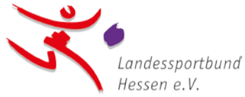
Landessportbund Hessen e.V.

Ein zentrales Problem bleibt der Sanierungsstau bei Sportanlagen. „Der Sport lebt davon, dass wir unsere Stimme erheben, wenn es um seine Zukunft geht“, sagt Kuhlmann. „Der 15. März wird für die Entwicklung des Sports in den kommenden Jahren richtungsweisend sein.“